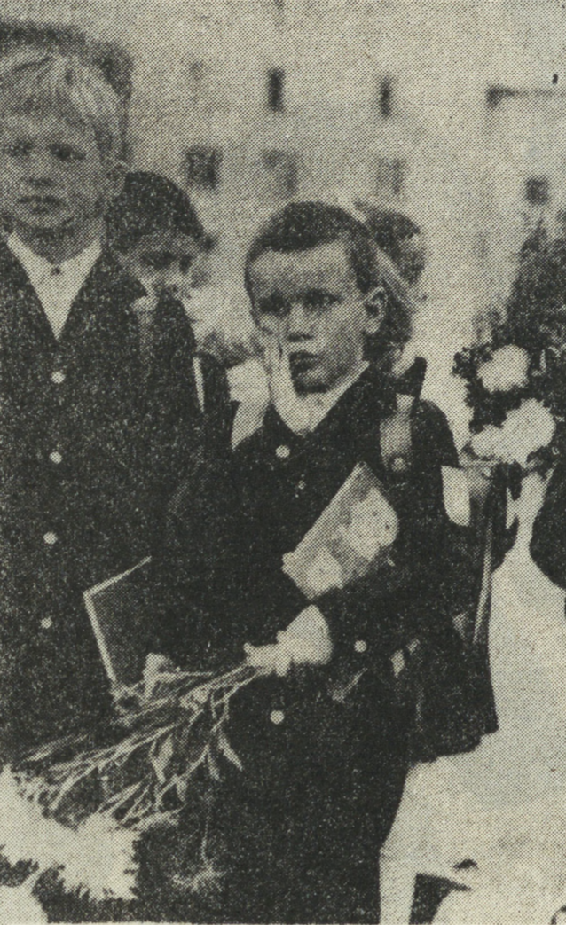
То ли еще будет!

Недавно в адрес школы № 4 Каменска-Уральского, пришло письмо из Советского комитета защиты детей: «Дорогие ребята! Мы с радостью узнали, что вы, как и все школьники нашей страны, вносите посильный вклад в благородное дело — борьбу за мир, против угрозы ядерной войны... Желаем вам, юные борцы за мир, вашим родителям, учителям, родным и близким здоровья и счастья, новых успехов в осуществлении прочного мира на Земле. Пусть всегда будет солнце!»