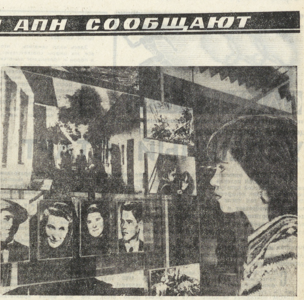
Фотомонтаж: у одного из стенов музея.

29 августа исполняется 40-я годовщина Словацкого национального восстания — одного из самых значительных событий в истории борьбы народов против фашизма в годы второй мировой войны.