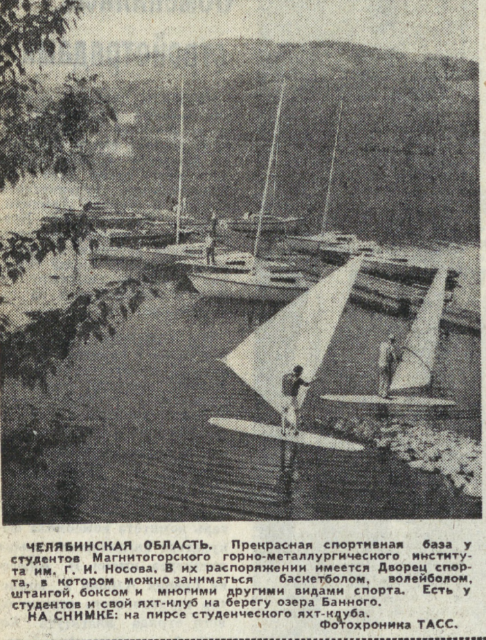
ЧЕЛЯБИНСКАЯ ОБЛАСТЬ. Прекрасная спортивная база у студентов Магнитогорского горно-металлургического института им. Г. И. Носова. В их распоряжении имеется Дворец спорта, в котором можно заниматься баскетболом, волейболом, штангой, боксом и многими другими видами спорта. Есть у студентов и свой яхт-клуб на берегу озера Банного.

НА СНИМКЕ: на пирсе студенческого яхт-клуба.