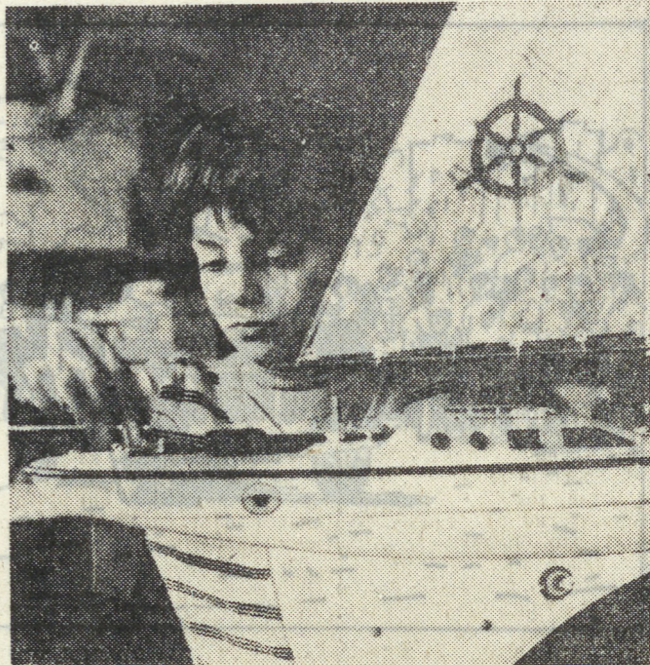
НА СНИМКЕ: в секции судомодельства Школьной академии в Пловдиве.