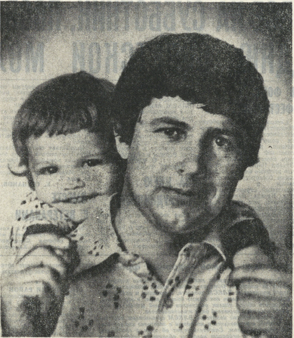
НА СНИМКАХ: после нелегкой работы чано-гравийного карьера.