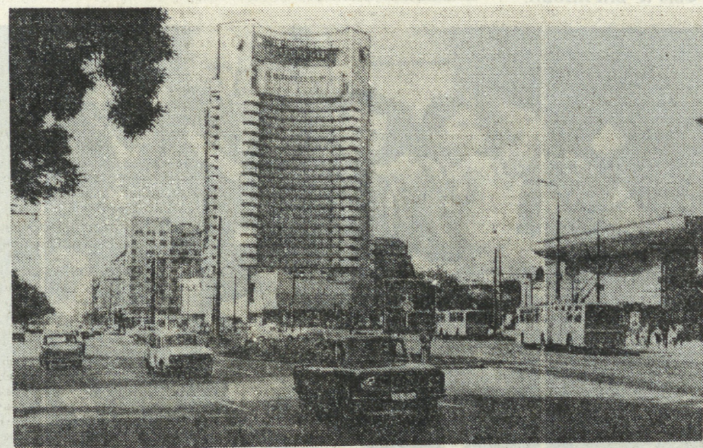
Планета в объективе