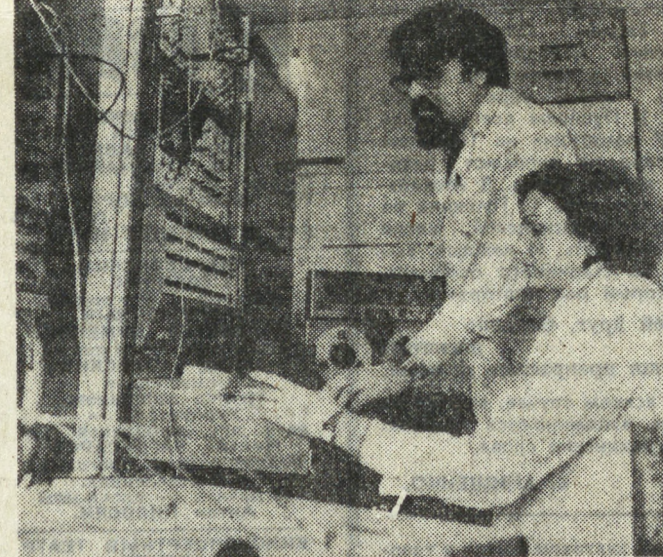
ГАНЦЫ ИЗУЧАЮТ ЯЗЫК ДРУЖБЫ

МАПУТУ. Вооруженные силы Мозамбика разгромили в районе Мауде базу вооруженных банд так называемого «Мозамбического национального сопротивления» (МНС) в провинции Мапуту. В ходе операции 37 бандитов убиты, захвачено большое количество оружия, боеприпасов, различного военного снаряжения.