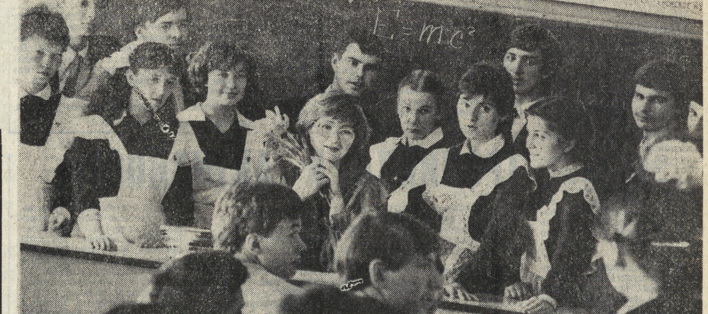
ЗАМЕНАЕМОСТЬ, она и нам присуща. Ведь химику, который постоянно ищет новые решения, необходимо чувствовать поддержку коллег.