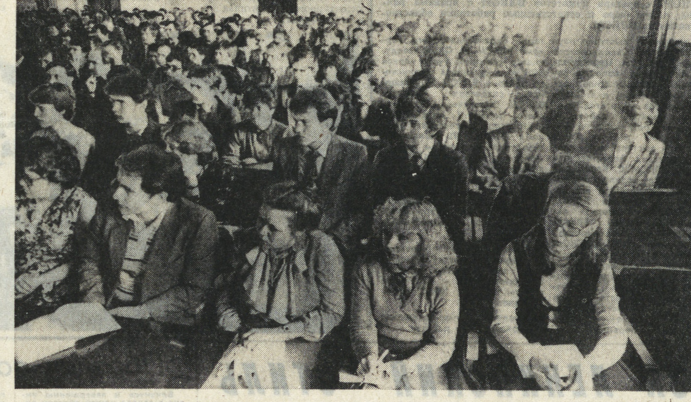
В ЗАЛЕ ЗАСЕДАНИЙ ОБЛАСТНОГО СЕМИНАРА-СОВЕЩАНИЯ.

Но сделать предстоит еще многое по искоренению прогноров, по развитию почва северцев в КМК. Об этом этом идет разговор на заседаниях комитета комсомола, бюро, на занятиях школ комсомольской политики.