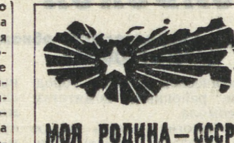
МОЯ РОДИНА - СССР

Сейчас в учебе секретарей комсомольских организаций и их заместителей большой упор сделан на практические занятия, деловые игры, дискуссии по основным проблемам комсомольской работы. Горногором ВЛКСМ практикует проведение для комсомольского актива информационные конференции с участием в них секретарей горногором КПСС, председателей исполкома, прокурора города, представителей отдела внутренних дел, руководителей крупнейших предприятий города.