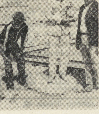
НА СНИМКЕ: на месте раскопок.