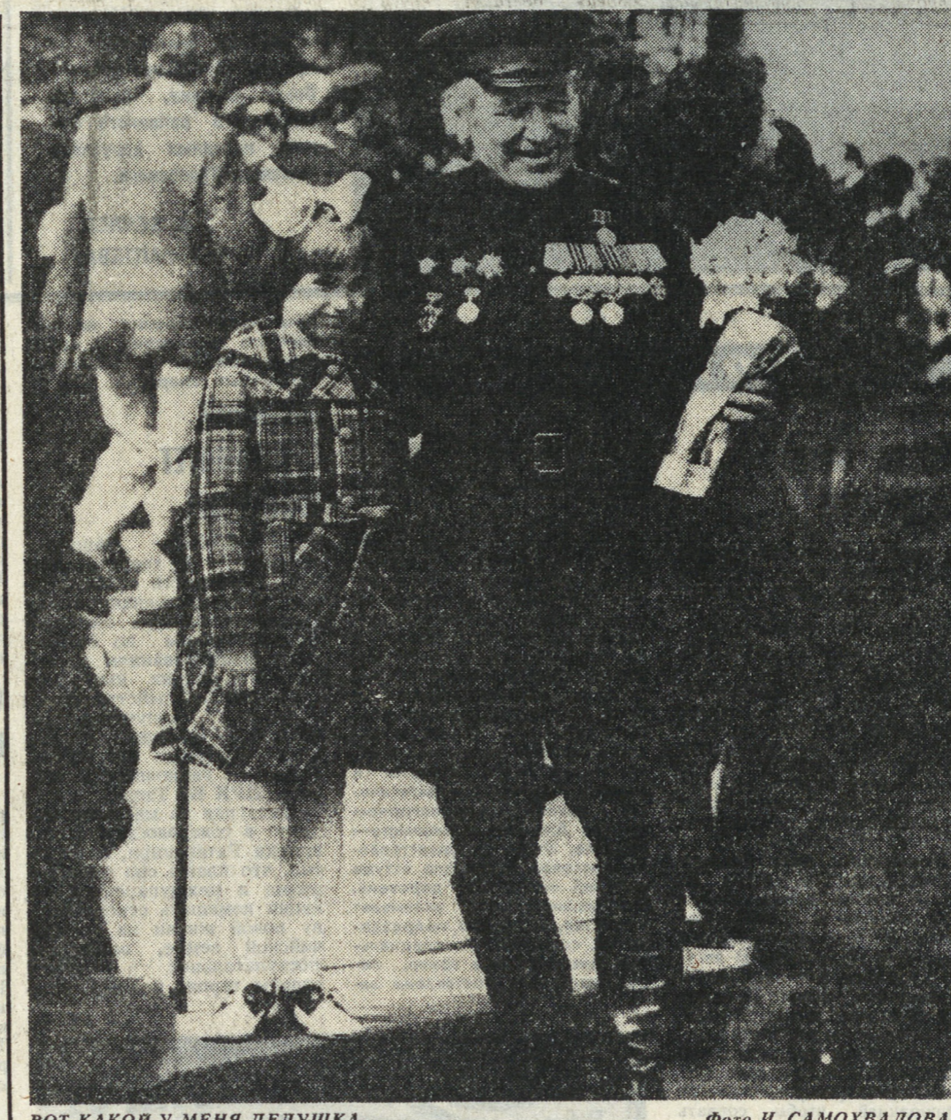
Вот какой у меня дедушка...

А. ПЕЧАТНИКОВА, руководитель группы пропаганды треста «Уралметремонт», Каменск-Уральский.