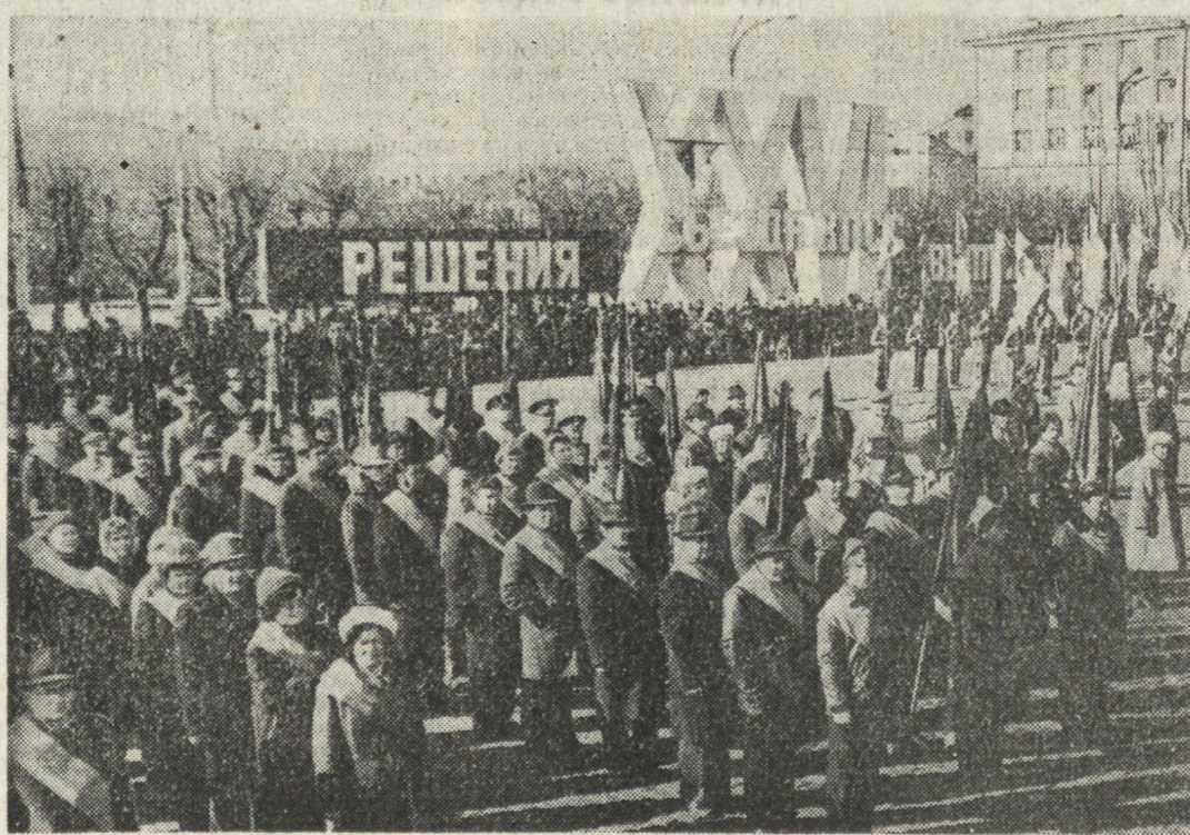
СВЕРДЛОВСК. ПЕРЕД НАЧАЛОМ ДЕМОНСТРАЦИИ.