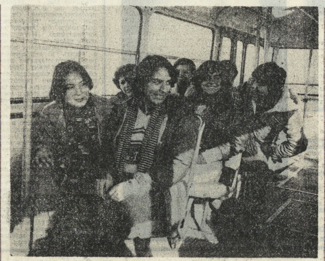
ТВОЙ СВЕРСТНИК ЗА РУБЕЖОМ