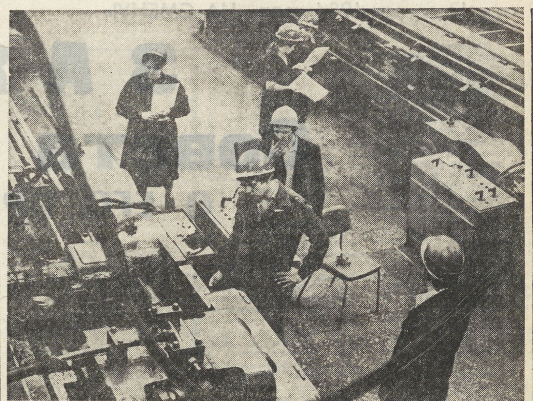
к 50-летию Первоуральского новотрубного завода