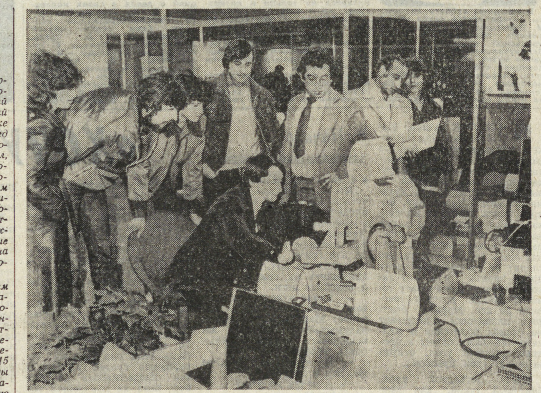
НРБ. «Высокому качеству — комсомольскую гарантию!» — так называется выставка, открывшаяся в Софии. На ней представлены более 500 разработок молодых рационализаторов и изобретателей, а также продукция молодежных бригад столицы.

ТОКИО. Население Гавайских островов решительно выступает против использования архипелага в качестве ядерной платформы Пенгасона. Как сообщает газета «Номури», муниципальное собрание острова Мауи объявило его территорией, а также окружающее воды и воздушное пространство — безъядерной зоной. Движение за образование безъядерных зон на Гавайских островах, где расположены крупнейшие военно-морские базы США на Тихом океане, охватило и другие острова. Самой большой остров архипелага — Гавайи — уже объявил свою территорию безъядерной зоной.