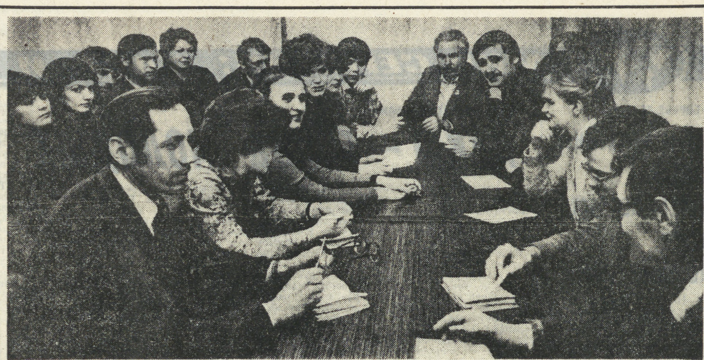
Среда, 18 часов 30 минут. Актив литературного клуба имени М. Пилипенко в сборе. Пора начинать очередное занятие.