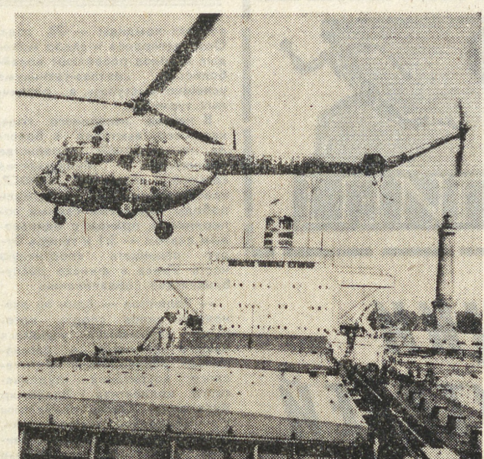
Исполнилось 35 лет Договору о дружбе, взаимной помощи и последовательном сотрудничестве между СССР и Польшей.