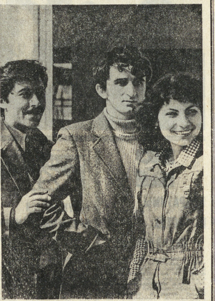
40 тысяч специалистов

«Граница на замке» — это значит, что наша любимая, огромная страна, все ее люди могут спокойно трудиться и отдыхать, учиться, воспитывать детей... Это значит — врагу не пройти на нашу землю, не нарушить ее мирную жизнь.