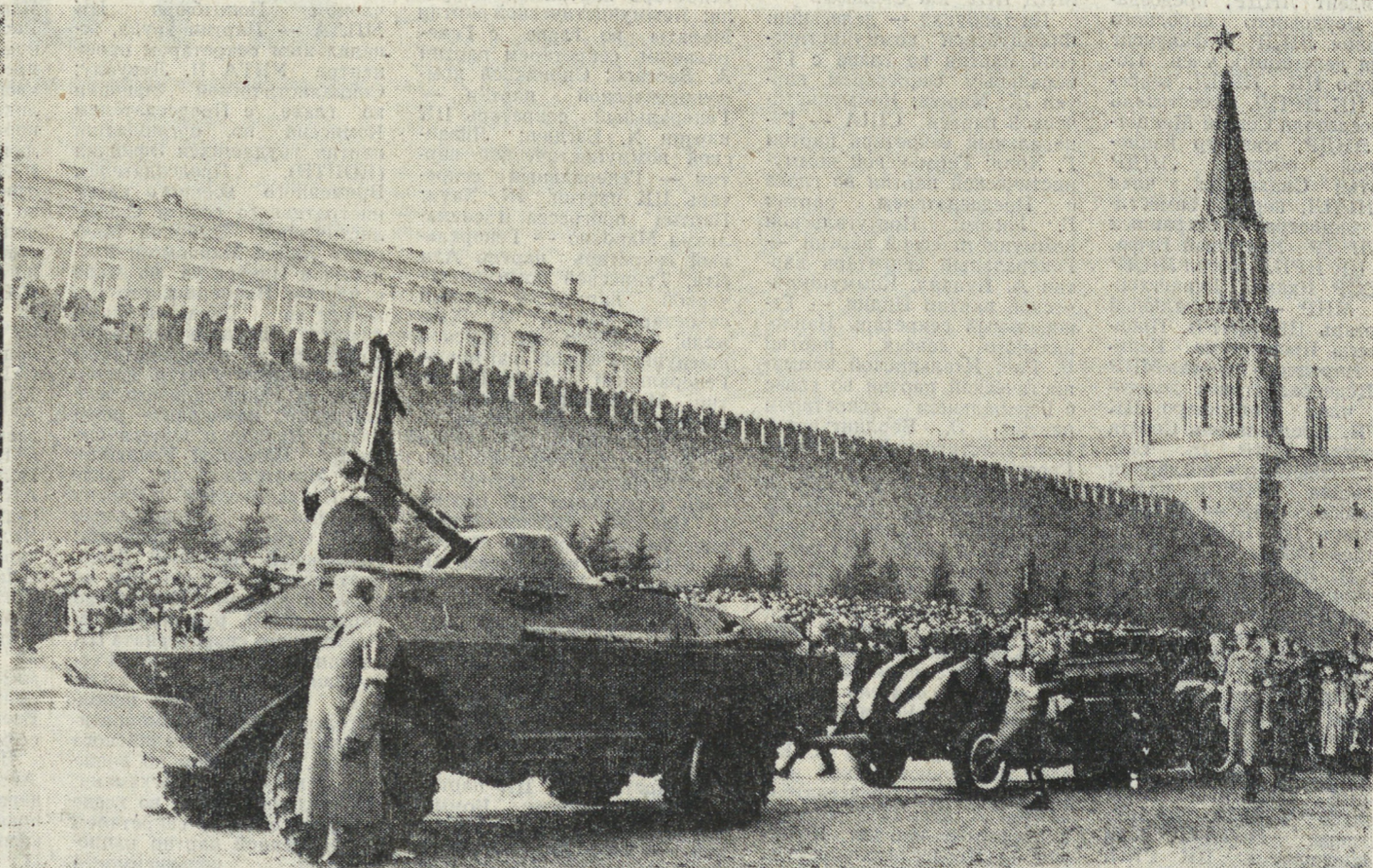
Во время похорон Ю. В. Андропова.