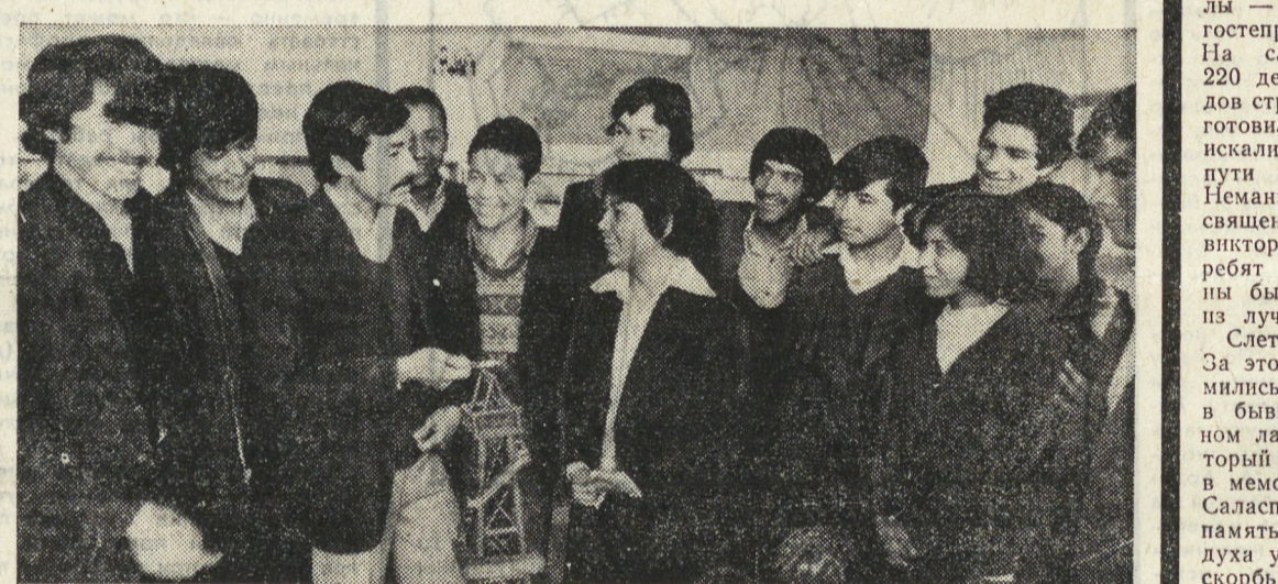
ДРА. В строительстве новой жизни весомый вклад вносит афганская молодежь — надежный помощник Народно-Демократической партии Афганистана.