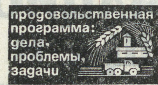
Продовольственная программа: дела, проблемы, задачи