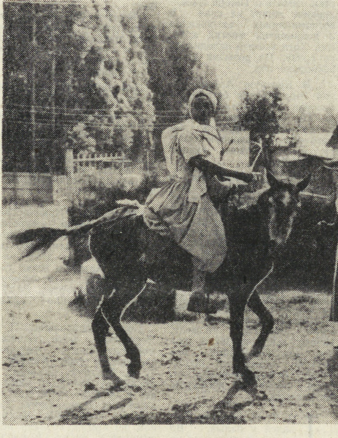
ОТОВСЮДУ — ОБО ВСЕМ

Народ Эфиопии добился значительных успехов на пути закрепления завоеваний национально-демократической революции.