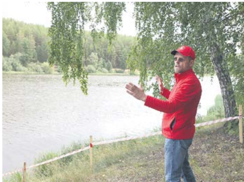
У каждого глэмпинга на берегу планируется свой пирс. Места под строения тоже определены.