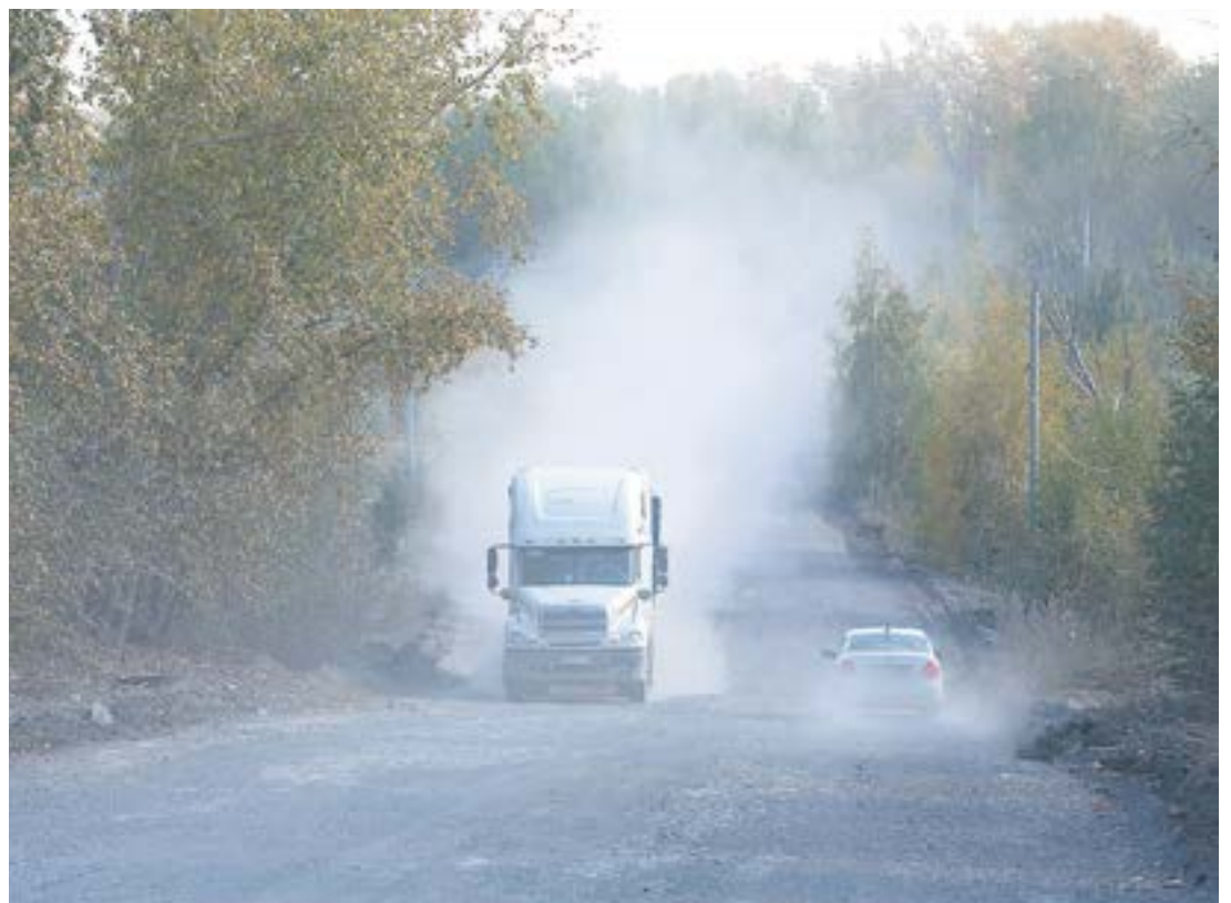
Если бы суд принял сторону заявителей, то из бюджета города на дорогу, которой пользуется не такое уж и большое количество ревдинцев нужно было бы потратить 93 млн рублей.

В настоящее время администрация заключила муниципальный контракт на разработку проектной документации по этому объекту. После получения положительного заключения государственной экспертизы на оба участка старой дороги, а также предоставления двум муниципалитетам из областного бюджета ассигнований, будут проведены совместные торги на капитальный ремонт автомобильной дороги Ревда — Первоуральск.