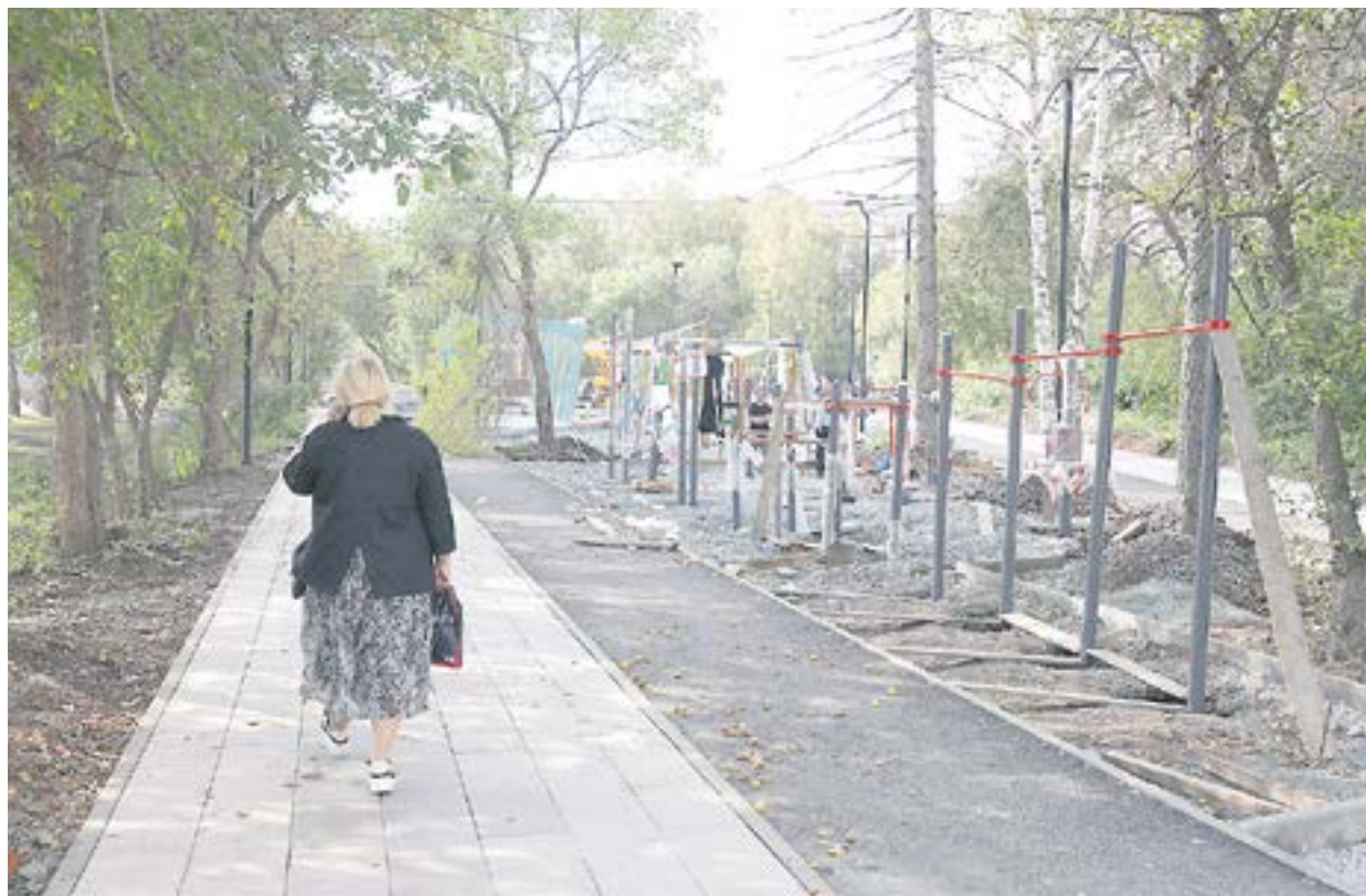
Самый готовый из трех объектов нынешней части Чеховского проспекта — Молодежный сквер, где установлено уже почти всё оборудование.

— Мы это будем делать в последнюю очередь, так как сейчас на площадке идут работы, много пыли и грязи, — пояснил прораб Алексей Зинкин.