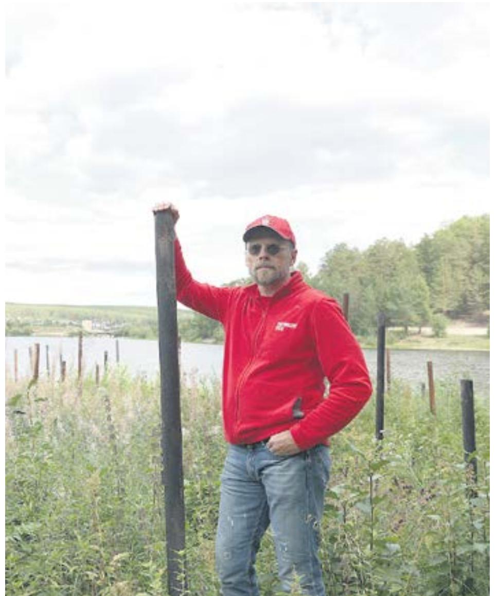
Полуостров за Мариинским прудом скоро обзаведется своей пристанью. Основания под нее уже готовы.