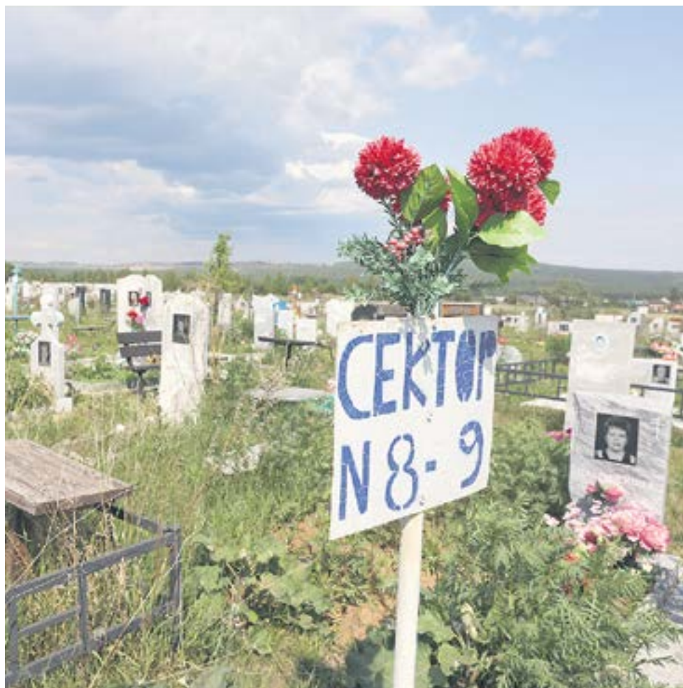
В ходе инвентаризации создана полная база данных по захоронениям ревдинского кладбища, а также определён объём резервной площади погоста.

— Где-то вырубить лес, где-то разровнять площадь. Это поможет ещё немного расширить резерв земли под захоронения, — пояснил Игорь Владимирович. — Хватит ревдинского кладбища ещё на четыре года максимум.