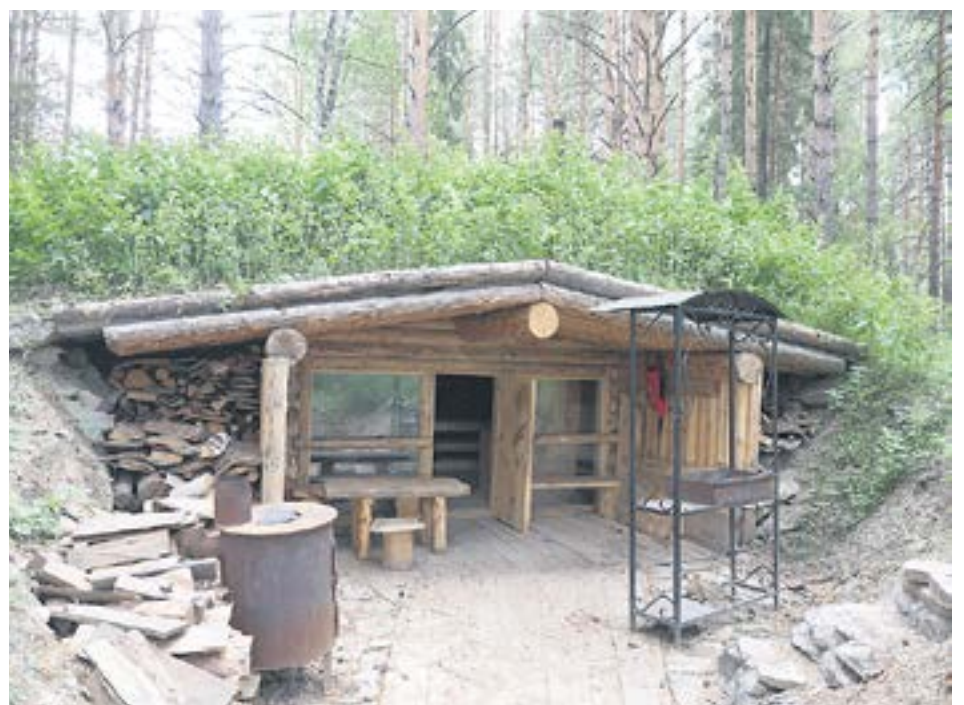
На базе уже есть несколько готовых объектов. Например, вот такая аутентичная землянка, в которой спокойно можно жить.

Всё, что мы увидели, это лишь начало. Дальше, ближе к центральному входу, проект турбазы начинает расширяться вширь в максимальное разнообразие, которого в Ревде еще не видели. Тут и домики на несколько персон (часть уже достроена), и шалаш из сена, где тоже можно переночевать, и треугольные домики «А-фрейм». А в этом году Игорь Алексеевич вместе с коллегами