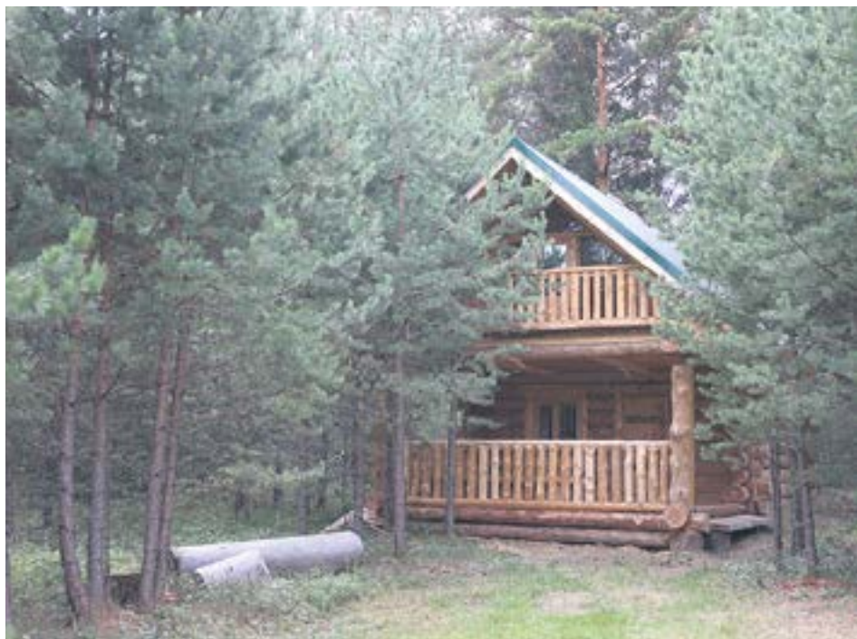
Будут и домики повышенной комфортности. Некоторые из них почти готовы.

Тут нас окружает все наше родное, русское, сельское. Попробовав этот воздух, просто снова хочешь жить.