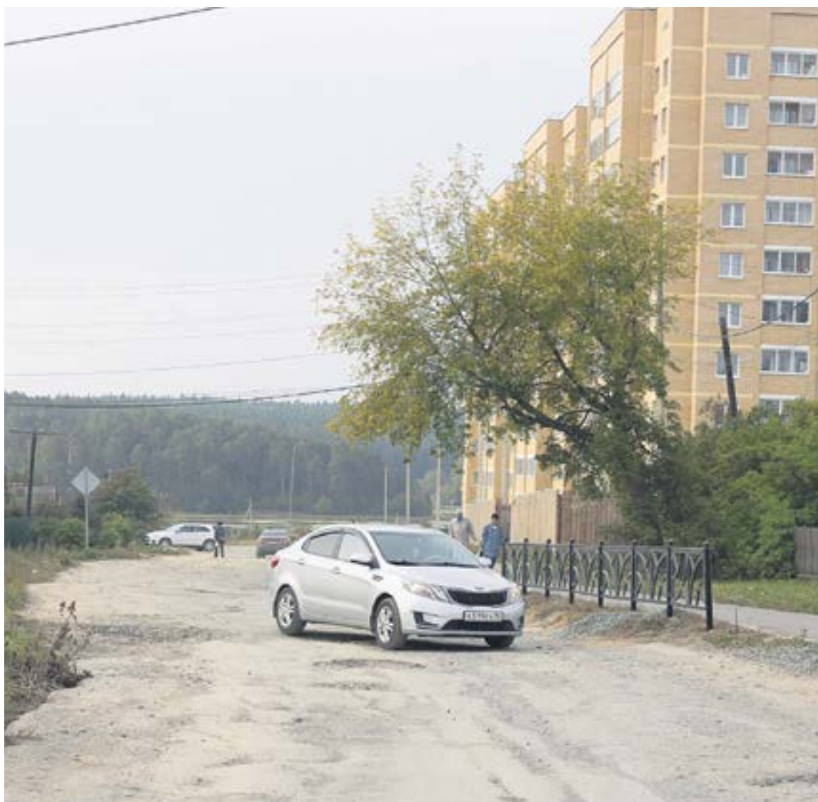
На участке до улицы Цветников появится долгожданная нормальная дорога и много чего еще.

Напомним, в феврале этого года депутаты Думы городского округа Ревда внесли в бюджет поправки, которые позволили выделить 4 млн рублей на разработку проекта автомобильных дорог (отрезок улицы Цветников — от Российской до Интернационалистов; и отрезок улицы Спортивная — от Российской до улицы Интернационалистов).