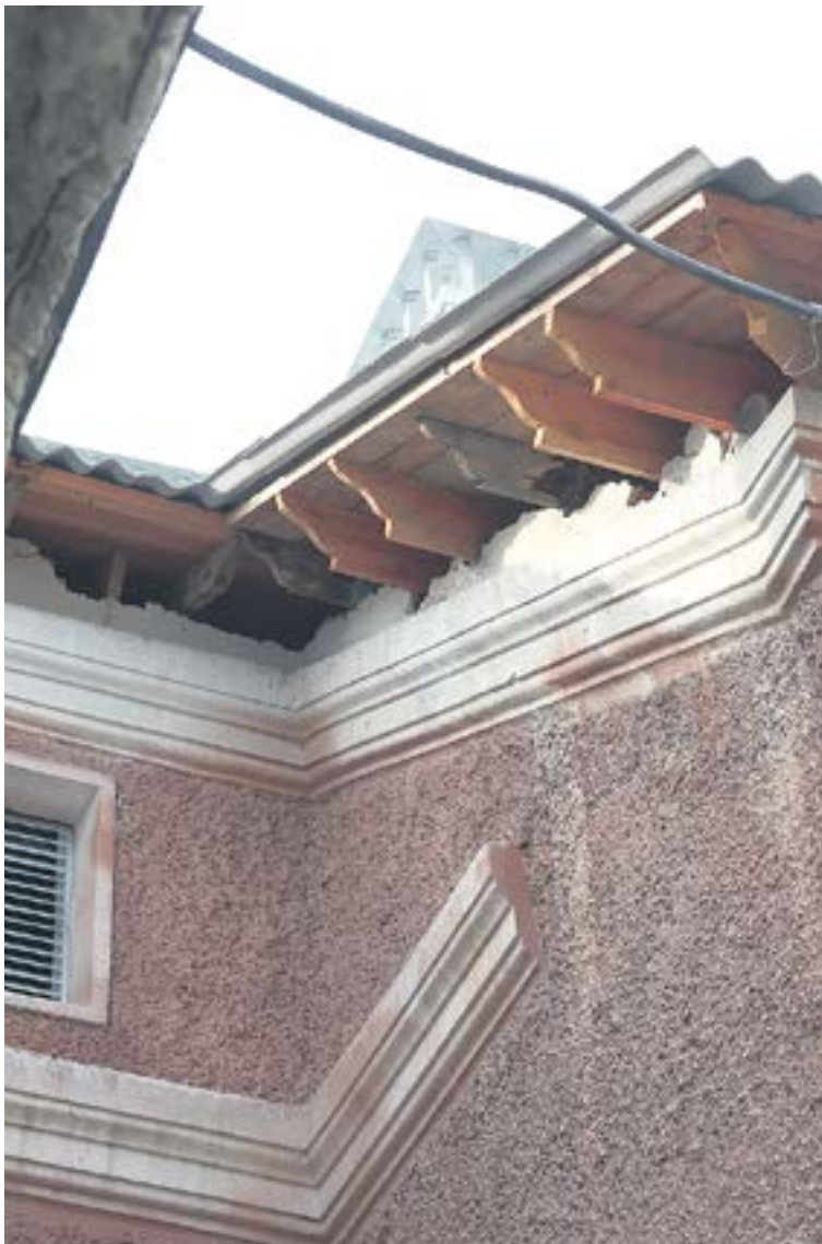
Вот такие дыры сейчас образовались под козырьком крыши дома №76 по улице Карла Либкнехта.

Сразу на двух домах в Ревде строители сломали часть карниза. И не хотят восстанавливать