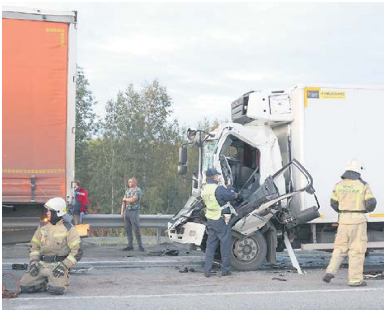
Вот, что осталось от кабины грузовика. Пострадал его водитель.