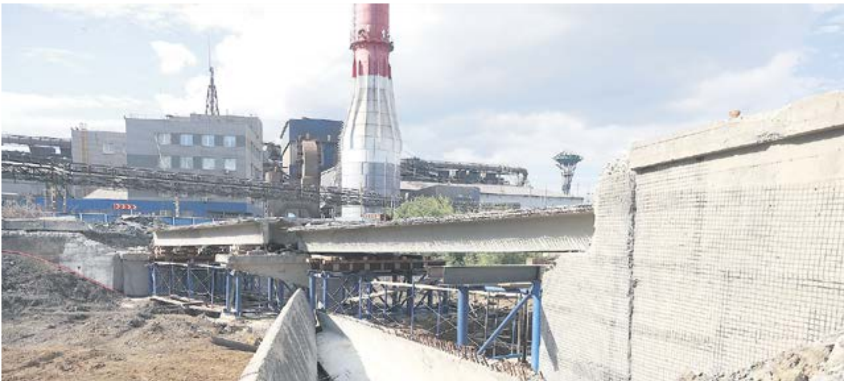
Новые мостовые балки привезут в конце сентября. К этому времени должны быть отреставрированы все опоры.

Что касается подхода к пешеходному мосту со стороны «Рябинушки», который вызвал массу нареканий у местных жителей: подход со стороны крутого спуска специалисты предлагают пока временно засыпать щебнем и асфальтом, чтобы у людей не было соблазна ходить там, где опасно. А подход сделать рядом, где склон не такой крутой. Именно там будет более комфортный и безопасный путь для пешеходов.