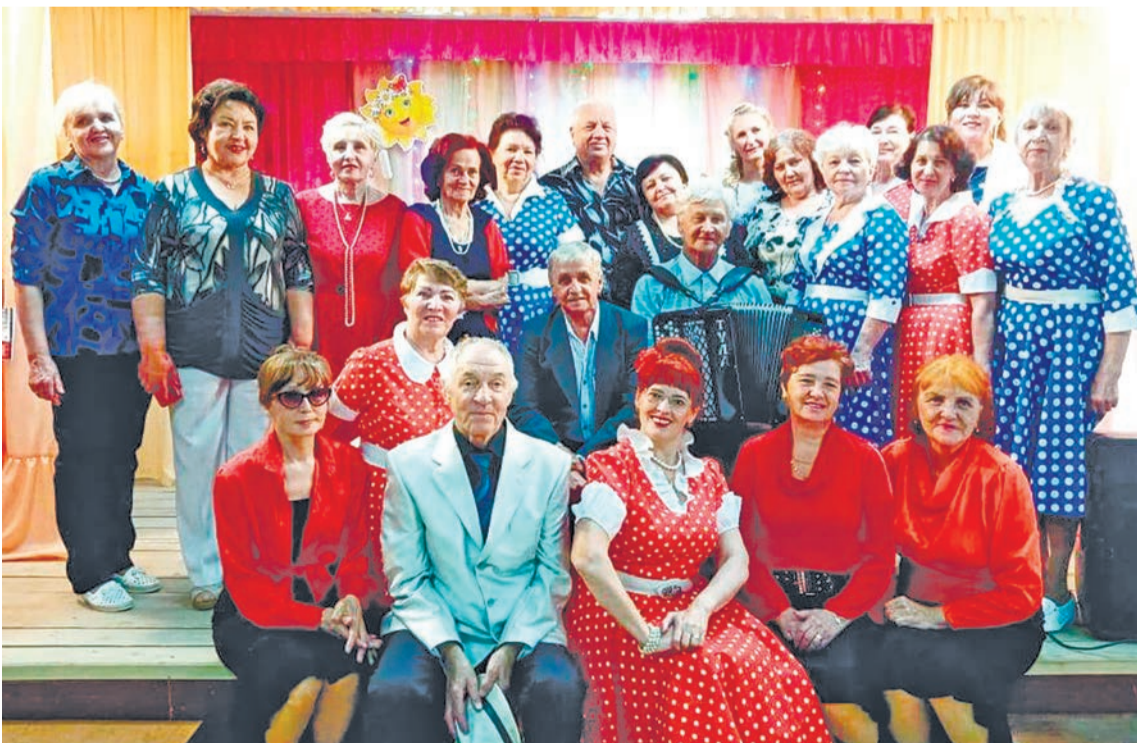
В «Берегиня» — закрытие сезона

ты и конкурсы. Один очень серьёзный и значимый для нас конкурс состоится уже в октябре, но это пока секрет. Надо съездить и дождаться результатов.