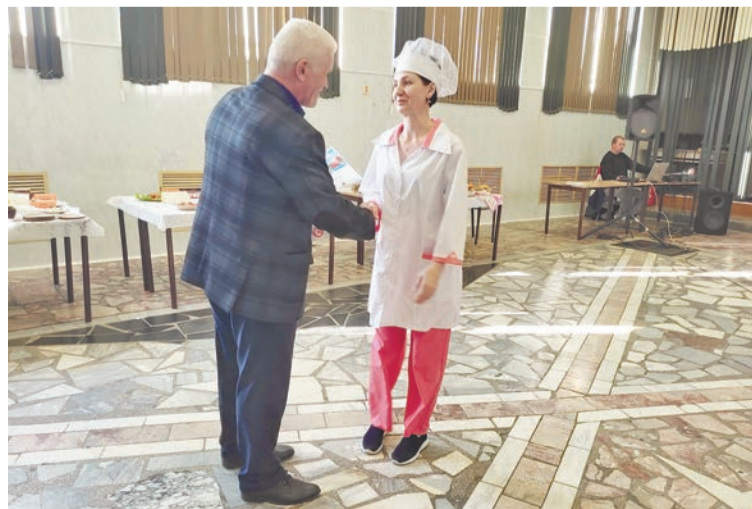
Жюри награждали участников за вкусные, гармоничные, оригинальные блюда