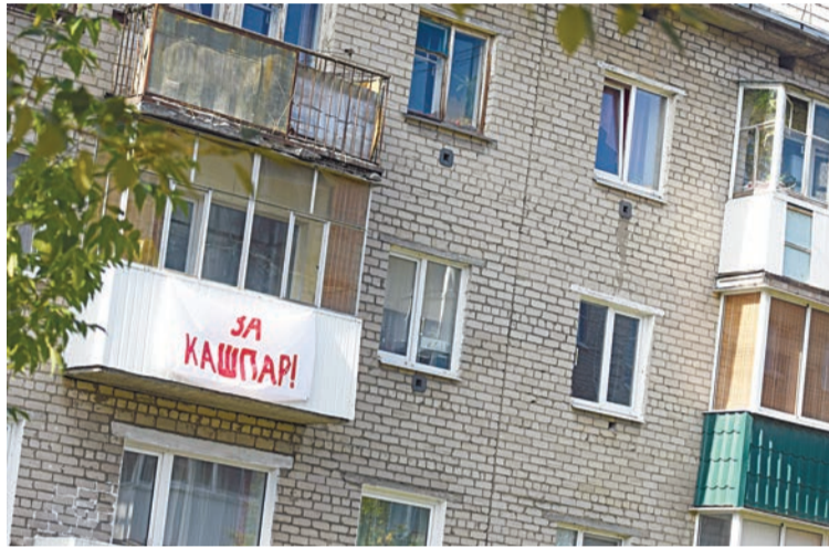
Такие простыни с фамилиями кандидатов «Команды Качканара» появились в городе 9 сентября, в день тишины. В полиции прокомментировали, что жалоб в связи с этим к ним не поступало

В прошлые годы такая явка означала бы провал выборов, но сейчас, когда отменен порог явки избирателей и выборы считаются действительными при любом количестве пришедших на избирательные участки, выборы с явкой в 33% считаются состоявшимися, а победа