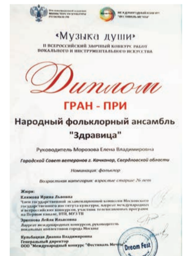
Один из самых значимых дипломов коллектива

А впереди осень... Как воспели её поэты — унылая пора. Но и осень у нас уже вся распланирована на концер-