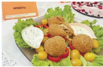
Крокеты от повара Комбината школьного питания №1 Алёны Шаметько