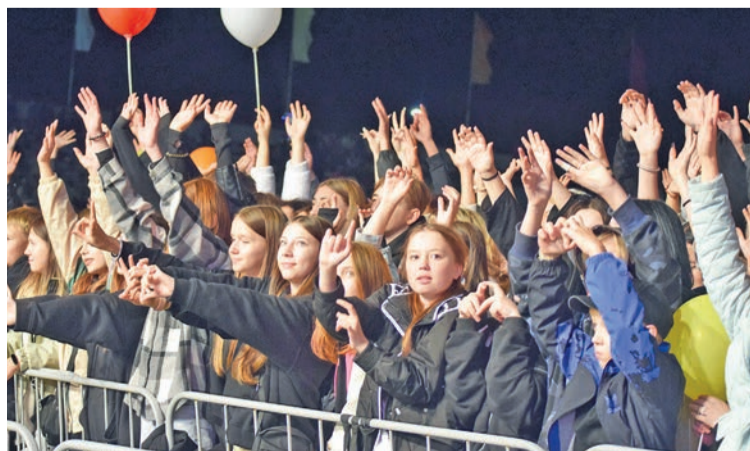
Молодежь активно подпевала артистам