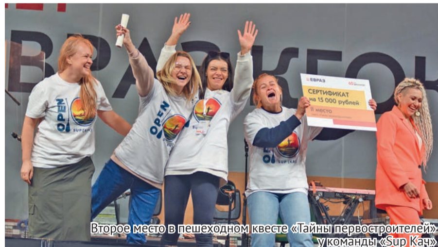
Второе место в пешеходном квесте «Тайны первостроителей» у команды «Sup Кач»