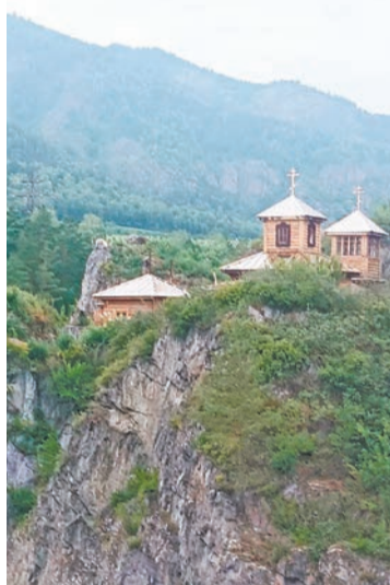
Храм на острове Патмос