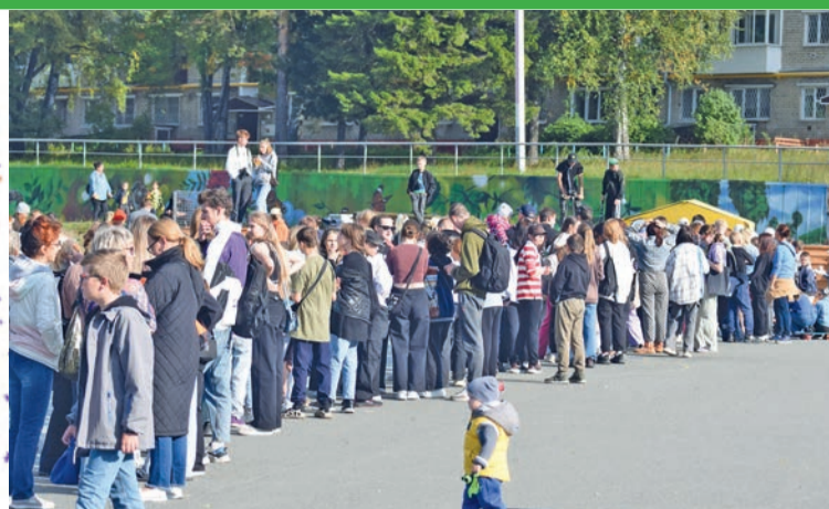
Очередь за сахарной ватой и поп-корном

граждением передовиков производства, концертом Сергея Минаева и группы «Градусы». В одиннадцать вечера над городом прогремел праздничный салют.