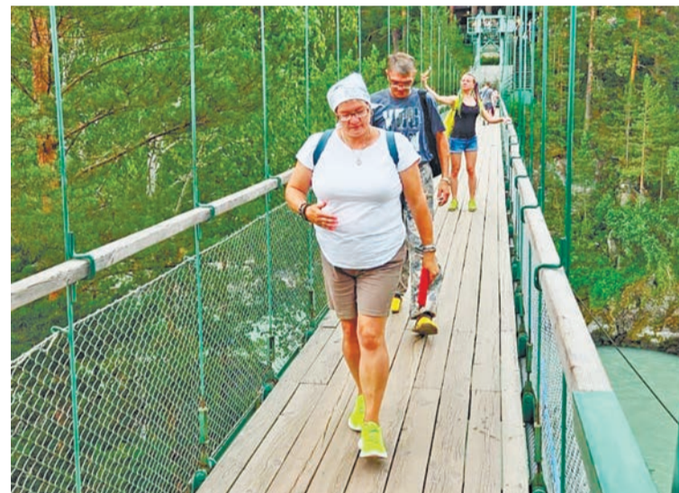
Путь к храму — по навесному мосту