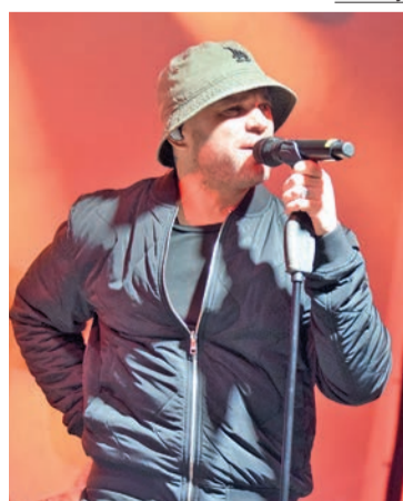
Солист группы «Градусы» Роман Пашков