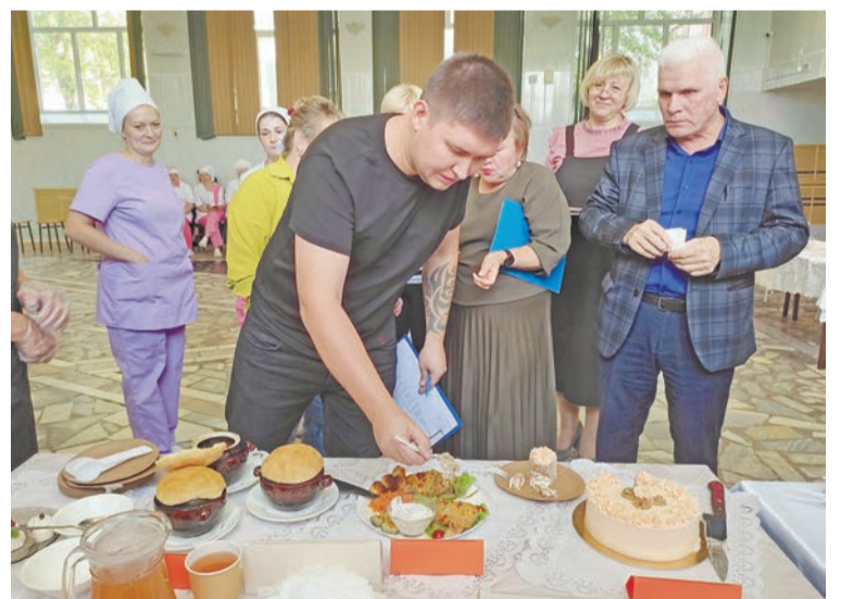
Члены жюри пробуют «Грибное лукошко», приготовленное поварами ИП Розенбах