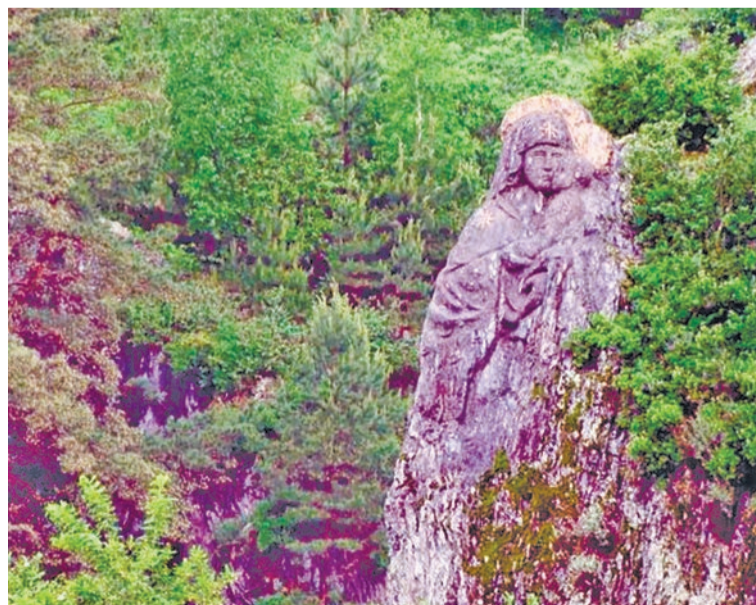
Икона на скале

останется у меня в памяти просто примером того, как человек может мечтать и совершать настоящие чудеса. И, конечно, великолепными видами со смотровой, с острова, с покачивающегося под твоими ногами мостика.