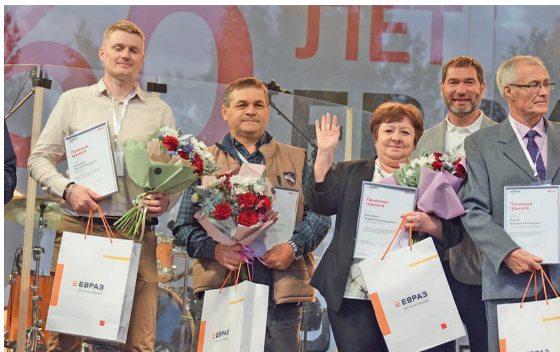
Награждение лучших работников комбината