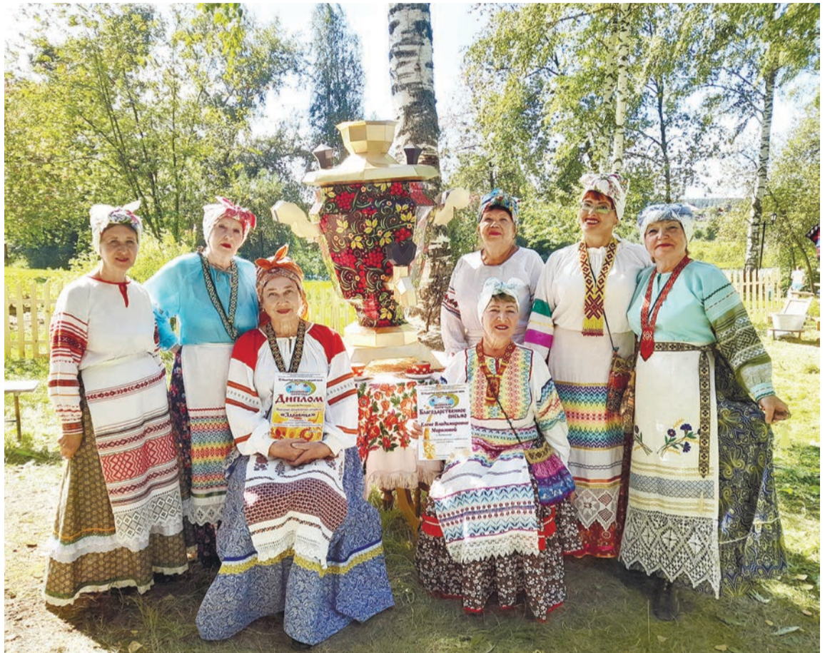
Фольклорный ансамбль с удовольствием выступил на «Лялинском Поречье»

В августе нам вновь приходит приглашение из Краснодара, для участия в Международном конкурсе «Священный звон колоколов Руси». Мы отправили две разнохарактерные казачьи песни. И здесь нас тоже ждала удача — два диплома Лауреатов 1 степени!