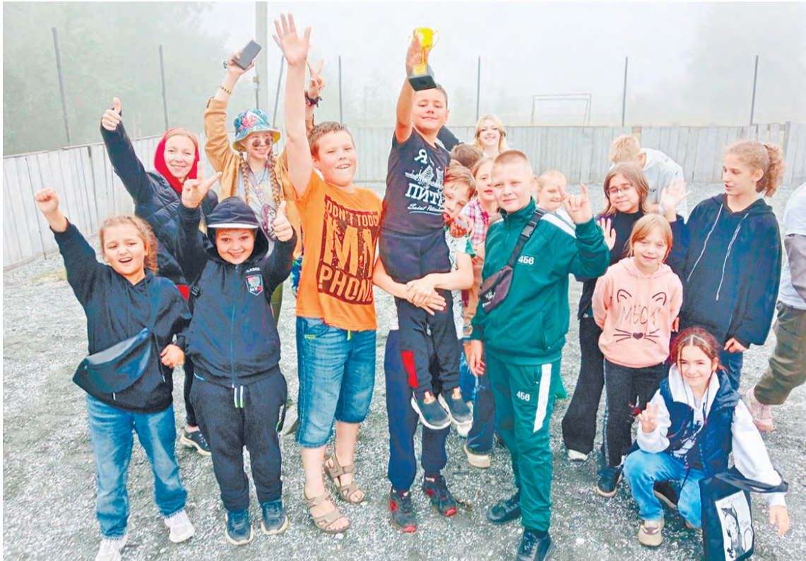
В летнем лагере Дома детского творчества всегда весело, познавательно и интересно

Этим летом организованно отдохнули и оздоровились порядка 4000 качканарских детей от 6,5 до 18 лет.