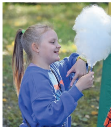
Любимое лакомство детей – сахарная вата