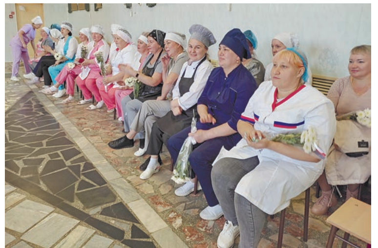
Повара рассказали, что дети просят их приготовить макароны с сосисками и наггетсы с картошкой фри