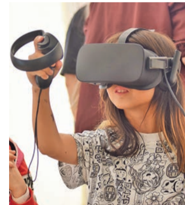
На аттракционе «Виртуальный художник»