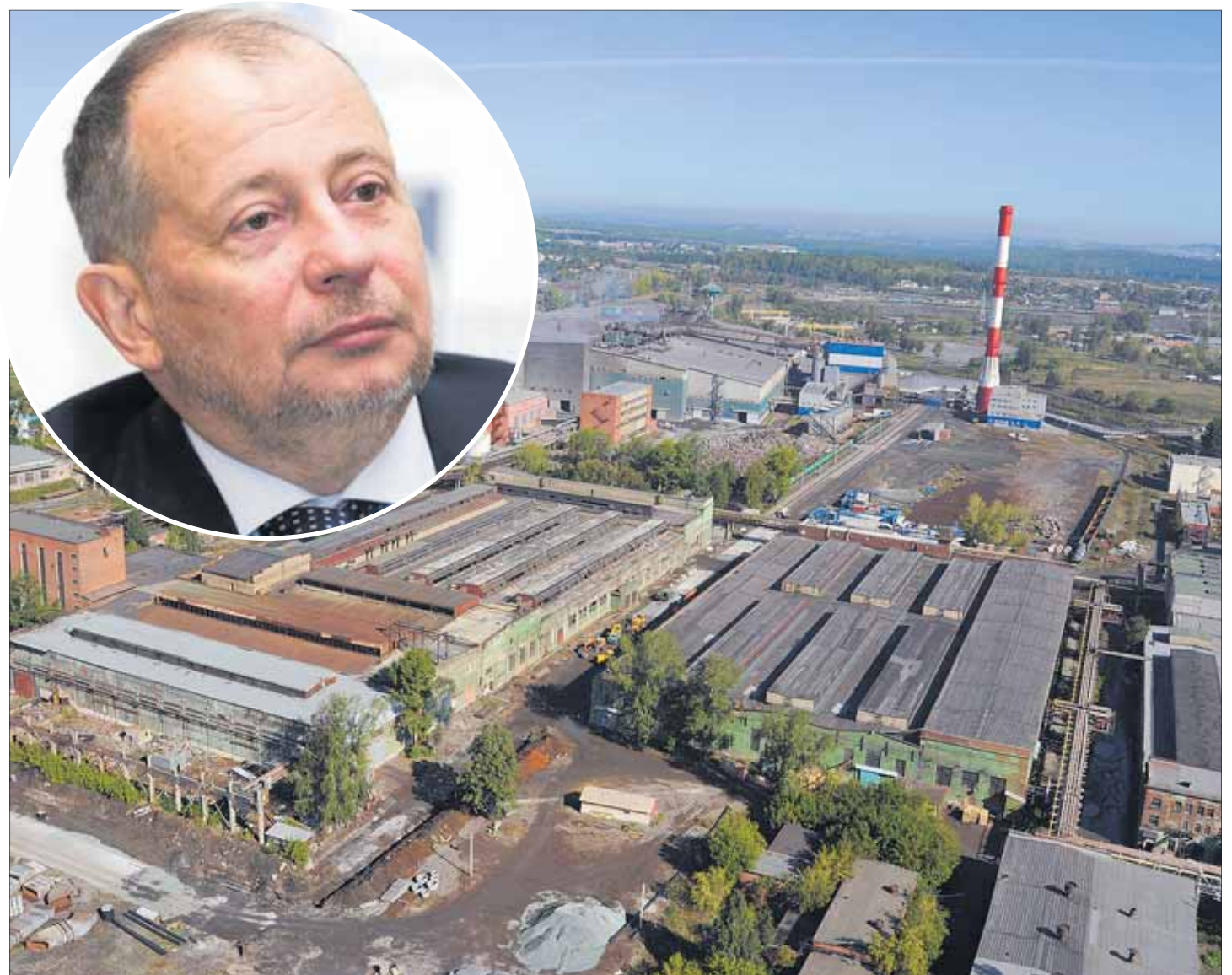
Фото завода: архив редакции, фото Владимира Лисина: Олег Яковлев (РБК)

Рассказываем все, что известно о крупной сделке по продаже холдинга, на стр. 4