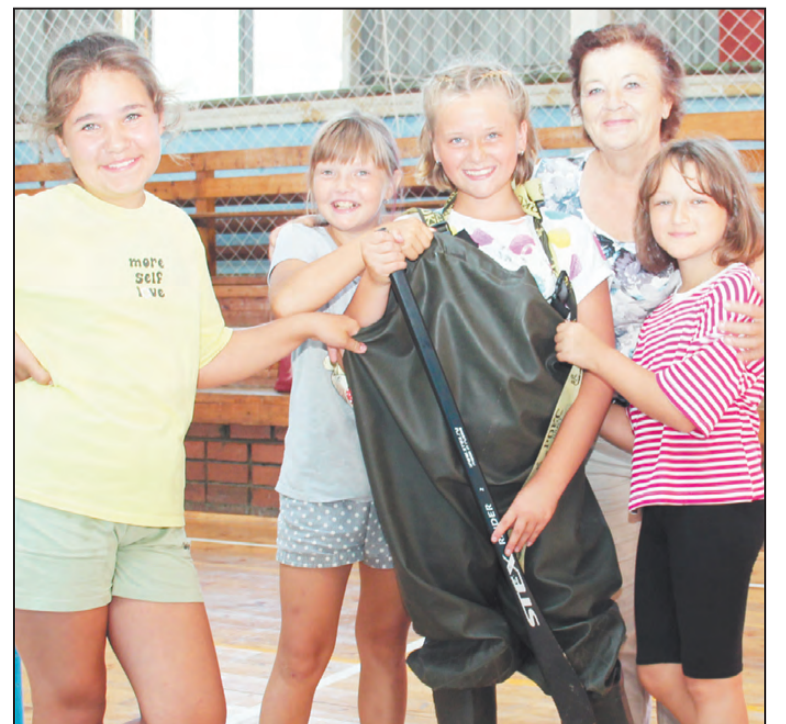
Клуб «Альтаир», с. Старые Арти

Каждая команда была награждена дипломами и приза-