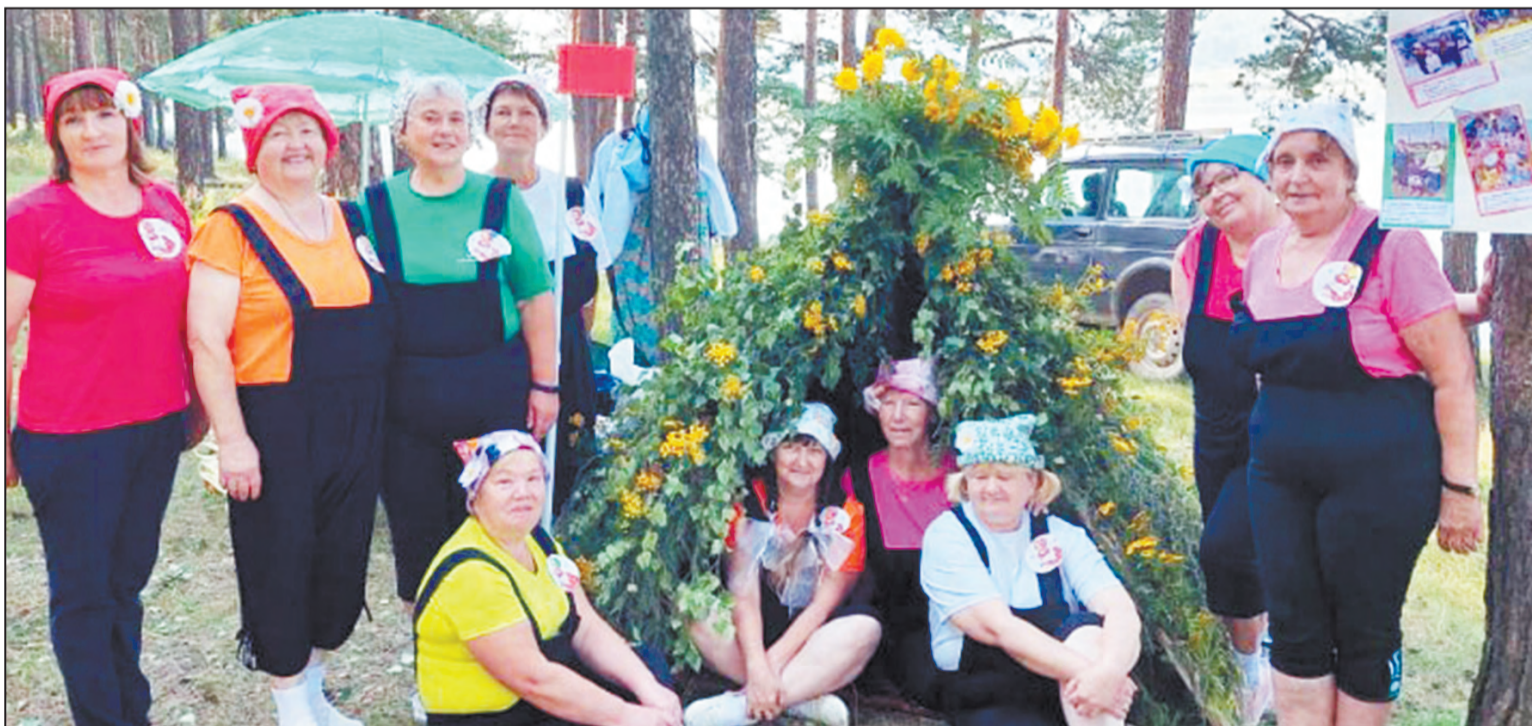
«Клевые девчонки из Поташки»

Но вот все команды себя показали, на других посмотрели, и далее по расписанию слета начинается квест «Мое босоное детство». Его десять этапов действительно взяты из детства. Это стрельба по мишеням из рогатки. В этом этапе участвуют все члены команды. Но не у всех получается попасть в цель, однако, шутки и смех восполняют промахи. Второй этап - прыжки на скакалке. Здесь участвует один член команды, и судья подсчитывает количество прыжков за 30 секунд. На скакалках скакать не разучились, в детстве это было любимое занятие у нынешних бабушек, по себе помню, как мы с подружками скакали и вперед, и назад, и скрестив руки. Третий этап - это «Планета мыльных пузырей». Это сейчас мыльные пузыри можно купить в готовом виде. А мы раствор производили, а вернее, разводили, из мыла самостоятельно. В данном этапе участвуют все члены команды (8 человек), нужно скрутить трубочки из газет и развести жидкость, а затем запустить мыльные пузыри. Они неслись по сосновому бору далеко и красиво. В четвертом этапе нужно было назвать все речки и реки Артинского района. Вспоминали. Торопились. Кто больше вспомнит - получит больше баллов, поэтому старались. Пятый этап - для рыбацких. Участвует один человек из ко-