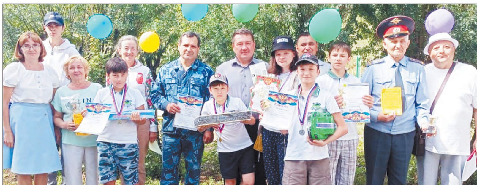
Участники турнира. Фото на память

Нам предстояло сразиться с детьми, и для