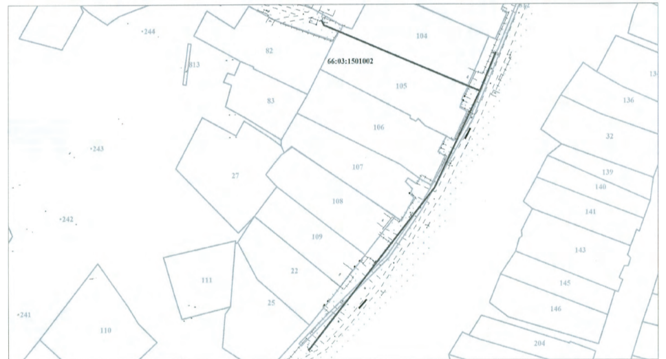
Приложение №2 к Постановлению Администрации Артинского городского округа от 31.08.2023 г. №473