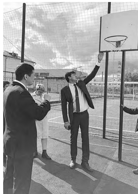
Баскетбольная площадка в шк. №2