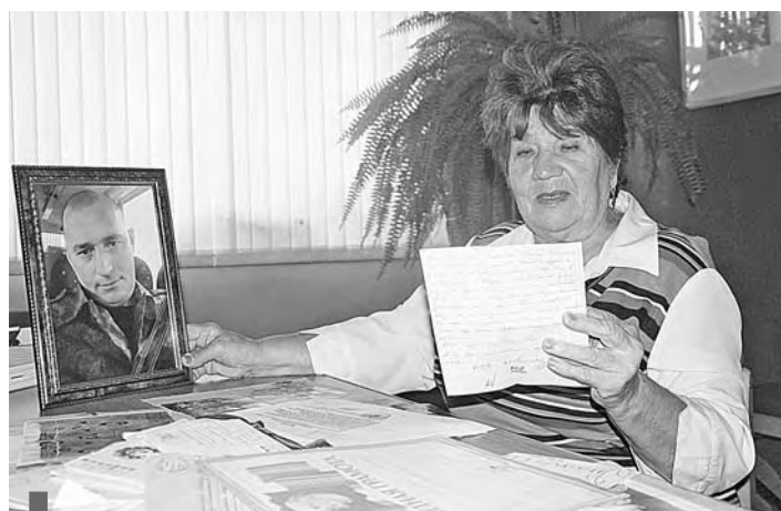
Письма сына греют материнскую душу