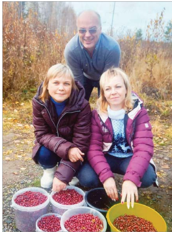
Привезли много клюквы.

- Готовимся обязательно. Если командный конкурс - значит, придумываем названия и девизы, эмблемы вырезаем, если «Весёлые старты» - в них все участвуют, и большие, и маленькие. Причём, у взрослых