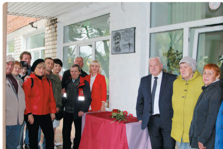
▲ Открытие мемориальной доски в Бисертской школе №2

Разговор о выборе профессионального пути после окончания школы у губернатора состоялся с учениками старших классов екатеринбургской гимназии №200. Здесь в День знаний глава региона посетил медицинский класс, где образование получают будущие медики, химики, биологи и фармацевты. Со школьниками Евгений Куйвашев поделился своим видением того, какие перспективы открываются перед людьми, изучающими естественно-научные дисциплины, и какими качествами должен обладать медицинский работник.