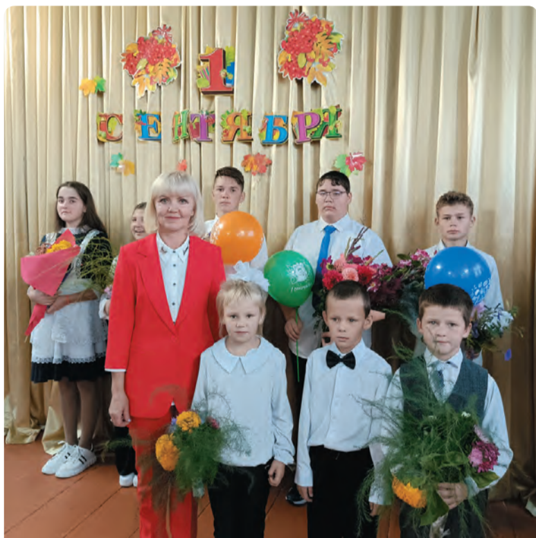
▲ День знаний в школе села Киргишаны