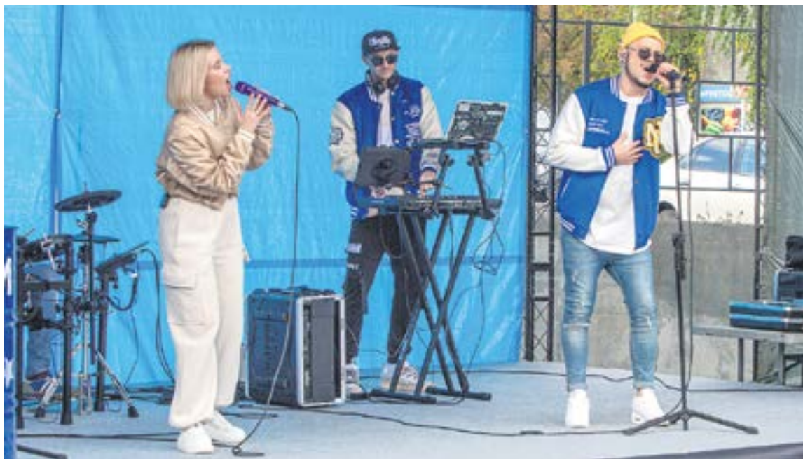
Группа «Мишки» исполнила как известные всем хиты, так и песни собственного сочинения.

У ТЦ «ДОМ» День города праздновали до 15 часов.