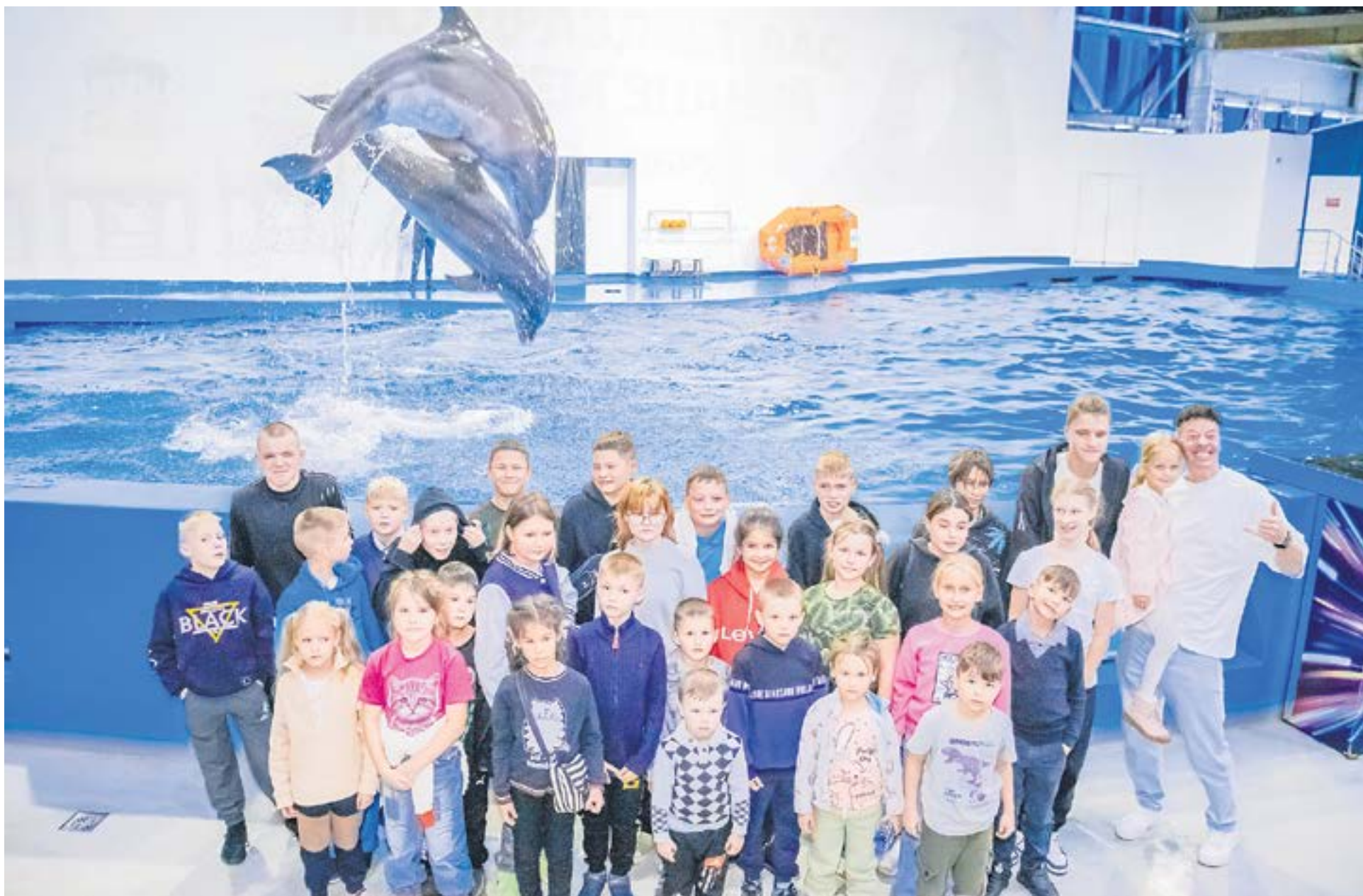
Воспитанники социально-реабилитационного центра для несовершеннолетних «Данко» отметили День знаний посещением дельфинария.