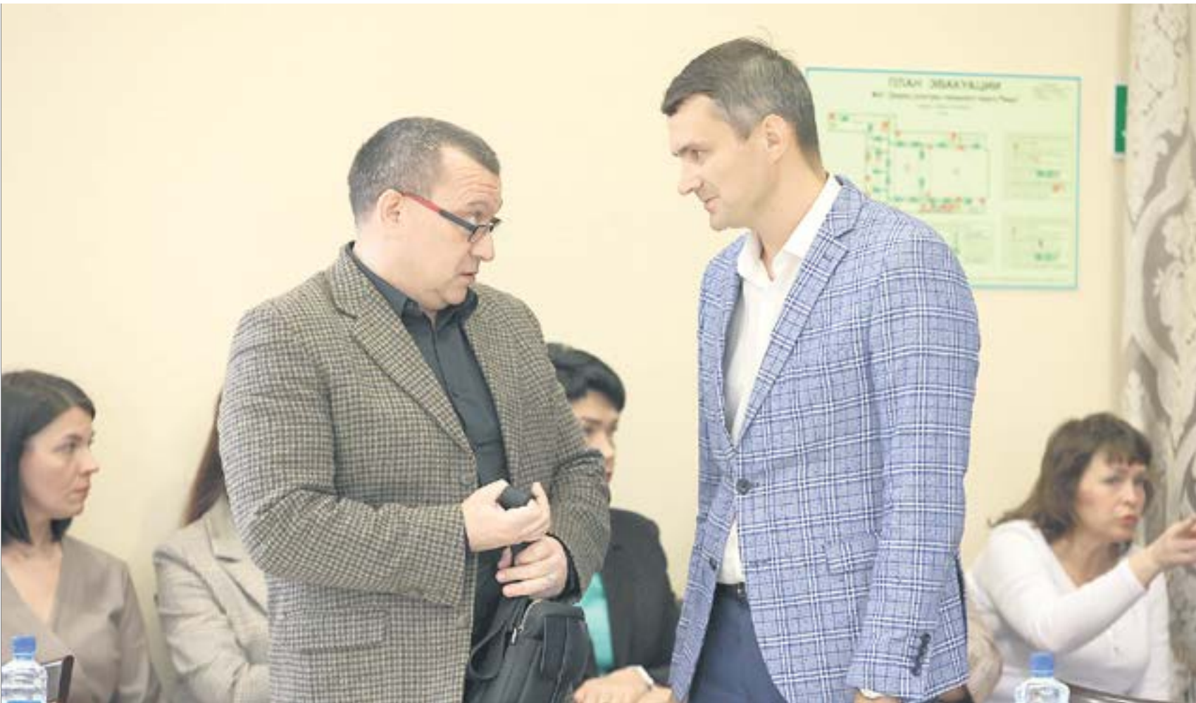
Представители коалиции историю с выдвижением почетных граждан сами окрестили «конфликтом». Видимо на это изначально и рассчитывали.