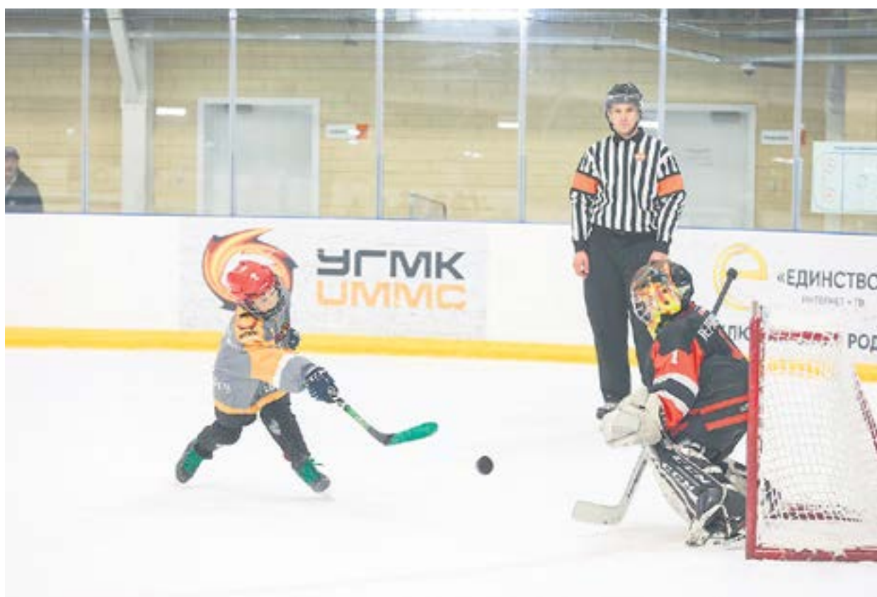
Хоккейная команда «Буря» успешно развивается и показывает хорошие результаты.

— Сеансы массового катания проходят в будние дни, чаще в дневное вре-