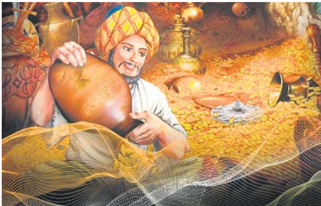
Иллюстрация к сказке «Али-баба и сорок разбойников».