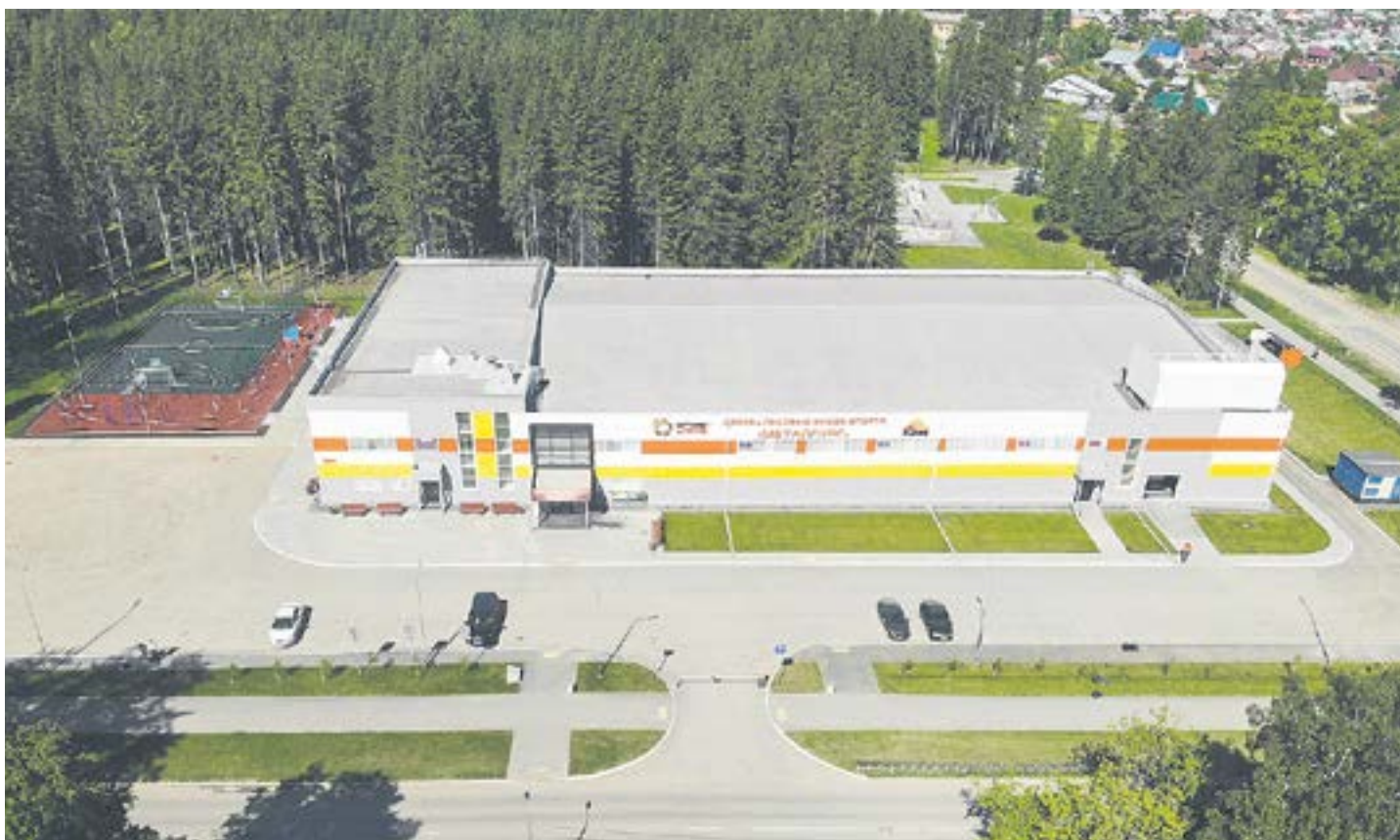
С момента создания Дворца Ледовых видов спорта прошло 5 лет, но уже кажется, что он был всегда.