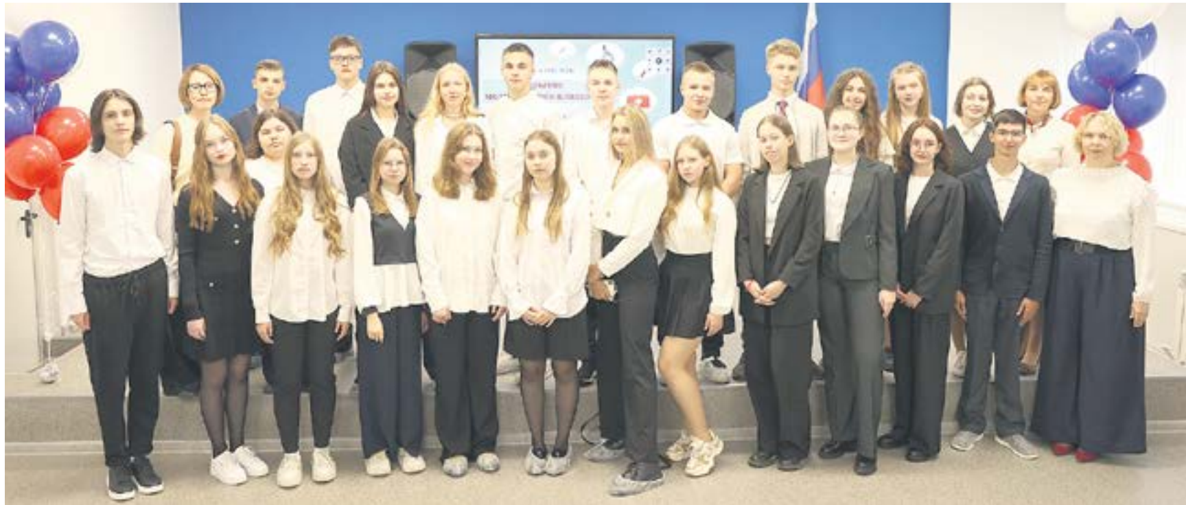
Ученики новых медицинских классов. Такого проекта в Ревде еще не было.

Стоит отметить, что проект «Меди- цинский класс» реализуется в сотру- дничестве с Ревдинской городской боль- ницей, Уральским государственным медицинским университетом и Сверд- ловским областным медицинским кол- леджем. Всего в области на данный мо- мент организовано уже 25 подобных медклассов.