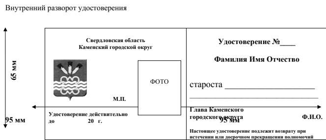
Приложение №2 к Положению