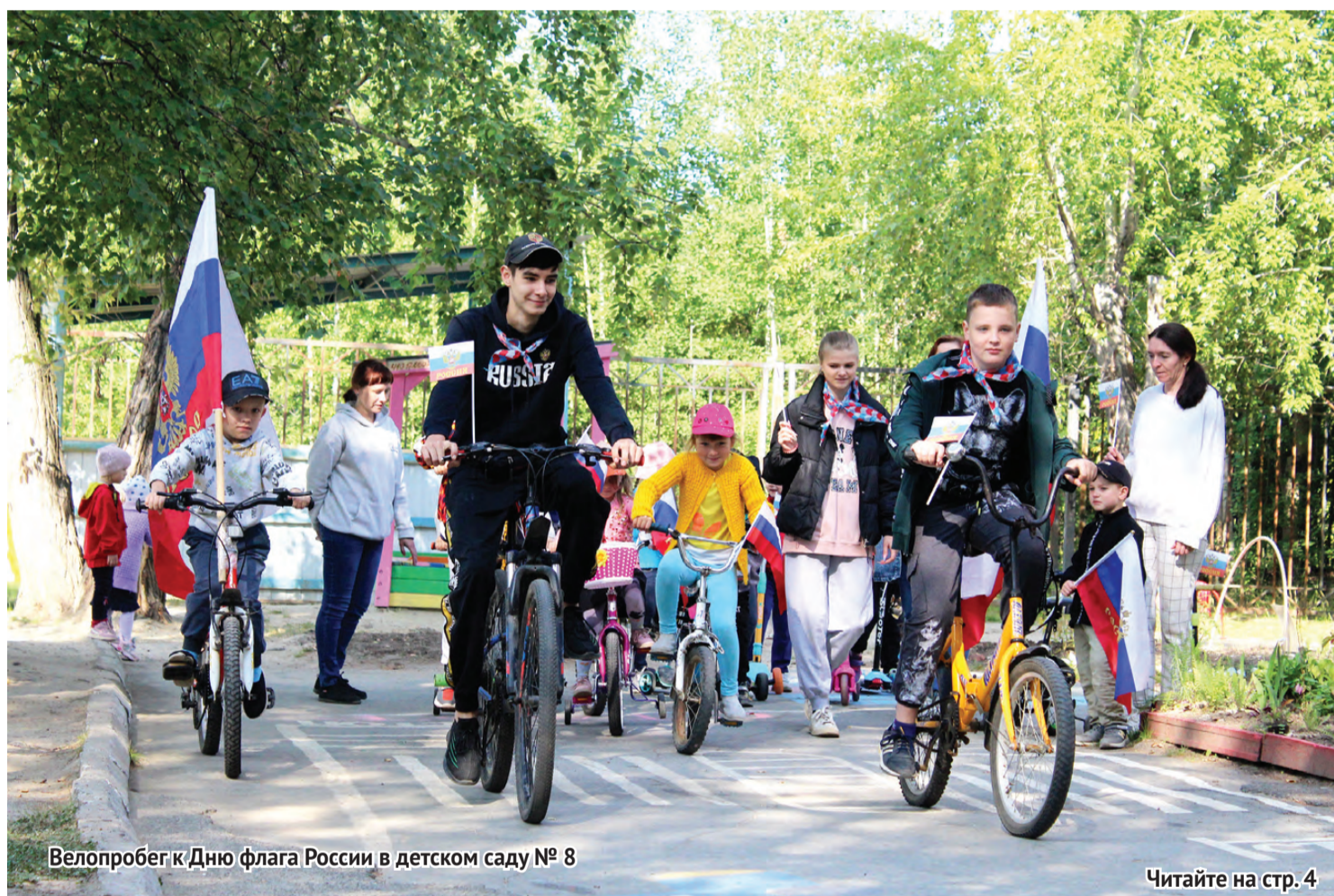
Велопробег к Дню флага России в детском саду № 8