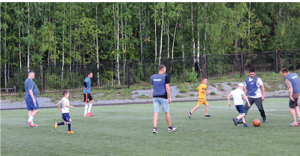
И дети, и папы показали настоящее мастерство в борьбе за голы