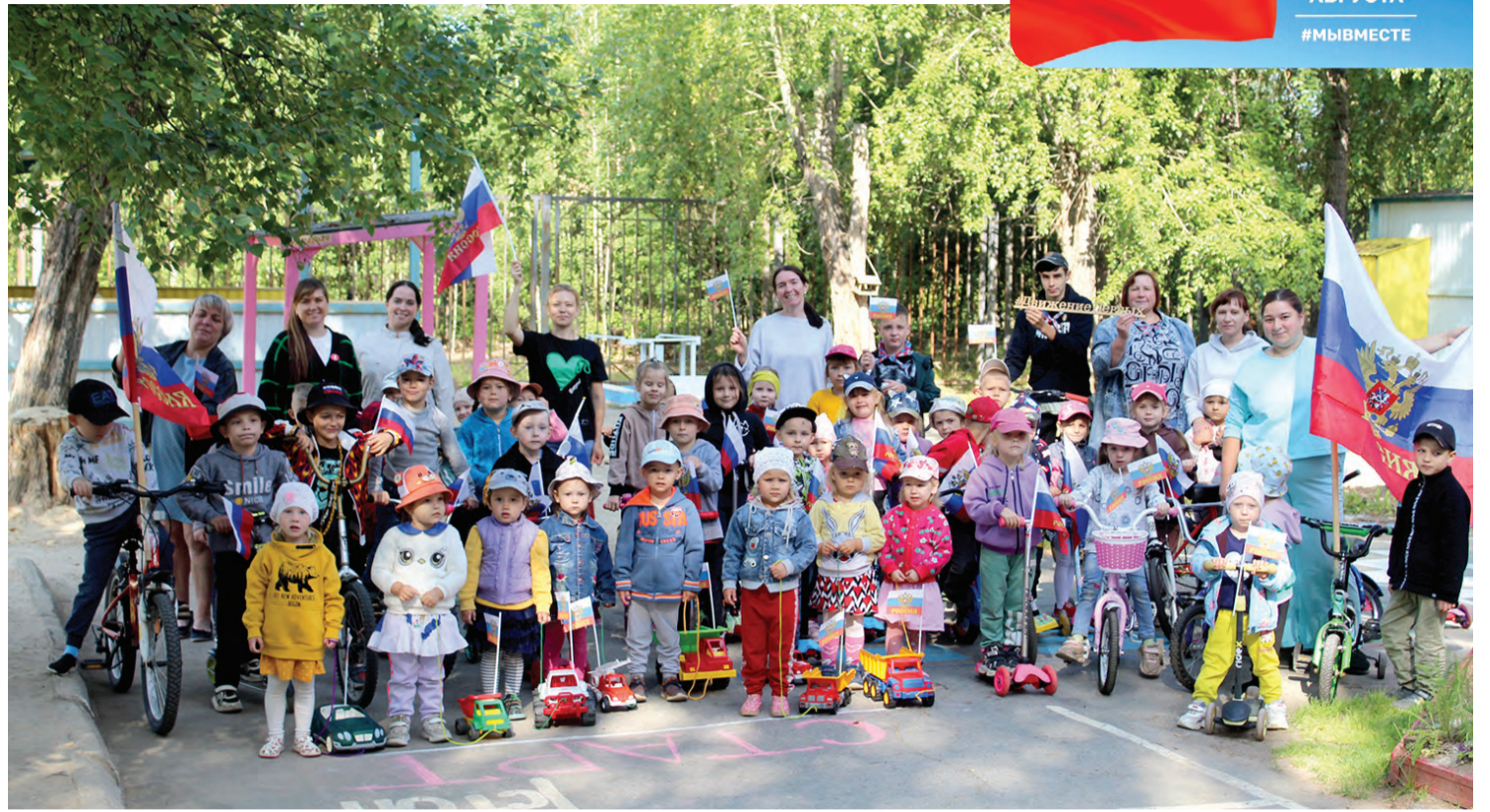
На старте велопробега

В заезде приняли участие воспитанники всех групп и ребята из местного отделения Российского движения детей и молодежи «Движение Первых» школы № 2. Участников акции приветствовали специалисты регионального отделения «Движение Первых» в ГО Красноуральск