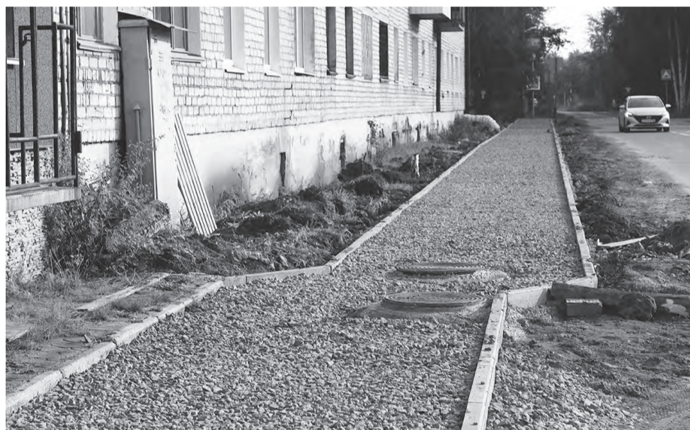
Строительство тротуара по ул. Дачной

– Для безопасности пешеходов на перекрестках улиц Янкина – Устинова и Маяковского – Карла Маркса появятся пешеходные «зебры», дорожные знаки, предупреждающие водителей о границах пешеходных переходов, и светофоры Т7 на солнечных батареях, – добавил Дми-