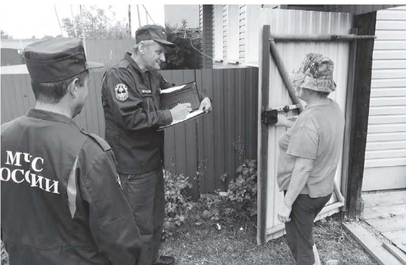
Профилактическая беседа с жителями

По статистике, наибольшее количество пожаров происходит в жилье, и причины этих пожаров неизменны: неосторожное обращение с огнем и пренебрежение правилами пожарной безопасности.