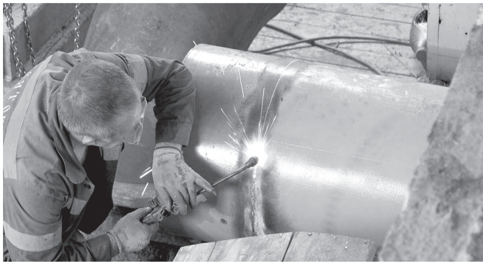
Работы на станции первого подъема

– В этом году у нас запланировано два мероприятия: капитальный ремонт открытого распределительного устройства на 35 кВ, а также модернизация самой станции первого подъема, – рассказал директор МКУ «Управление ЖКХ и энер-