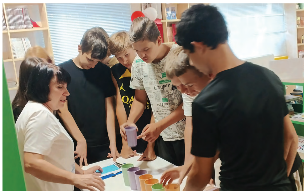
Так, так! Кто же учил химию и верно определил яд...