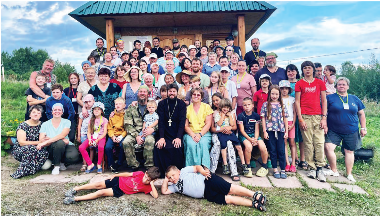
Участники слета трезвости и здоровья «Сретение»

Участники слета поделились с редакцией «КР» подробностями поездки и рассказали, что слет трезвости и здоровья «Сретение», организованный Нижнетагильской епархией и благотворительным фондом «Сретение», проводился в Моршинино уже в четвертый раз. Для участников слета была подготовлена обширная духовно-просветительская программа, спортивные состязания, культурные мероприятия, развивающие программы для детей и многое другое. В течение недели собравшиеся общались и обсуждали самые разнообразные аспекты трезвенно-