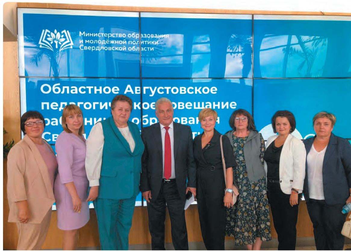
В Областном августовском педагогическом совещании приняли и педагоги Бисертского городского округа

Кроме того, со следующего учебного года в школах вместо ОБЖ планируется ввести «Основы безопасности и защиты Родины», где будут рассказывать не только о том, как вести себя в экстренных ситуациях, но и преподавать начальную военную подготовку.