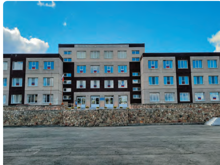
В образовательных учреждениях Бисертского городского округа в этом году проходили, в основном, косметические ремонты...

Накануне нового учебного года участие в Областном августовском педагогическом совещании приняли и учителя Бисертского городского округа – педагоги в ходе пленарных дискуссий обсудили приоритетные направления работы педагогического сообщества на новый учебный год.