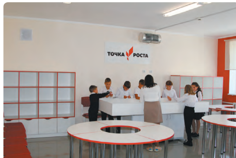
...в порядок приводились не только учебные кабинеты, но и столовые, рекреационные зоны, места общего пользования