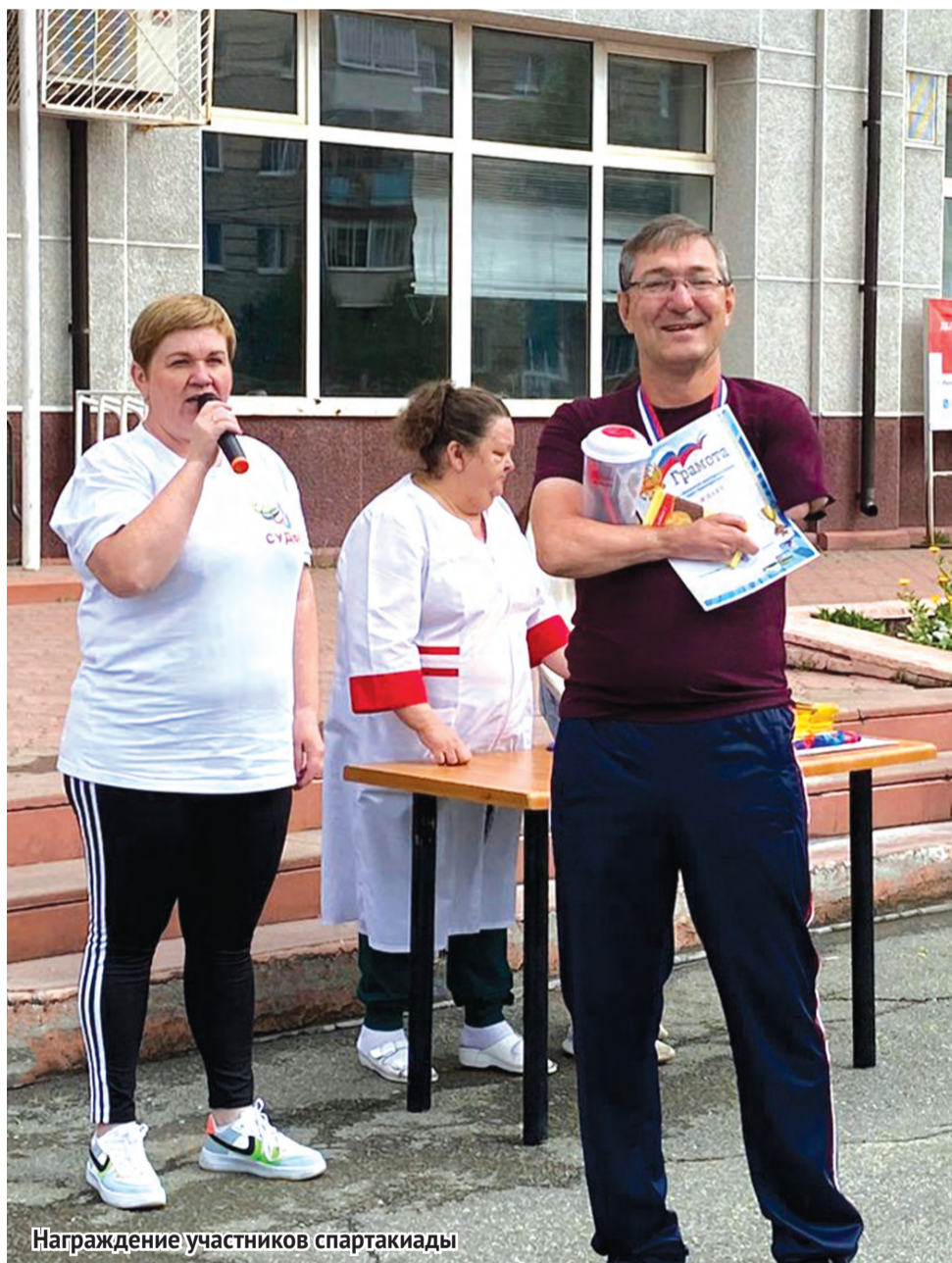
Награждение участников спартакиады