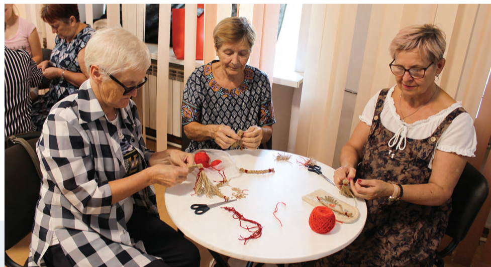
За изготовлением оберега здоровья

– И вновь старшее поколение с большим энтузиазмом откликнулось на призыв поучаствовать в мероприятии «Акция «Пожелание здоровья», – рассказала нашему изданию методист МАУ ГО Красно-