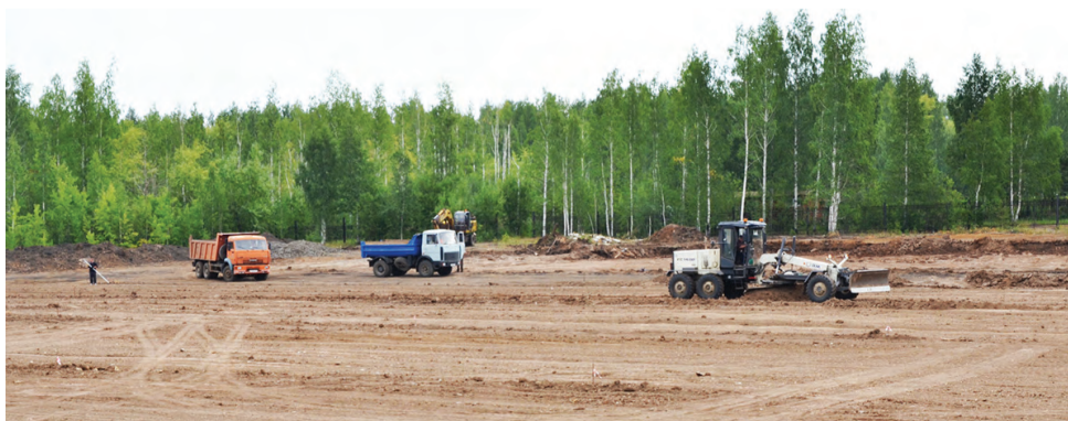
Работа началась. Идет очистка территории