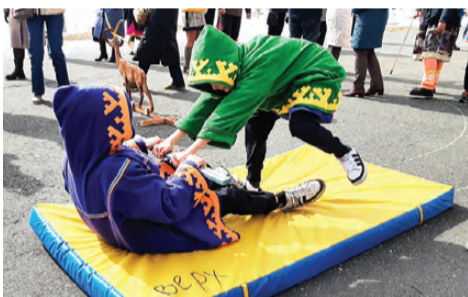
Состязание в силе и ловкости

Затем праздник продолжился на школьном дворе. Гости стали участни-