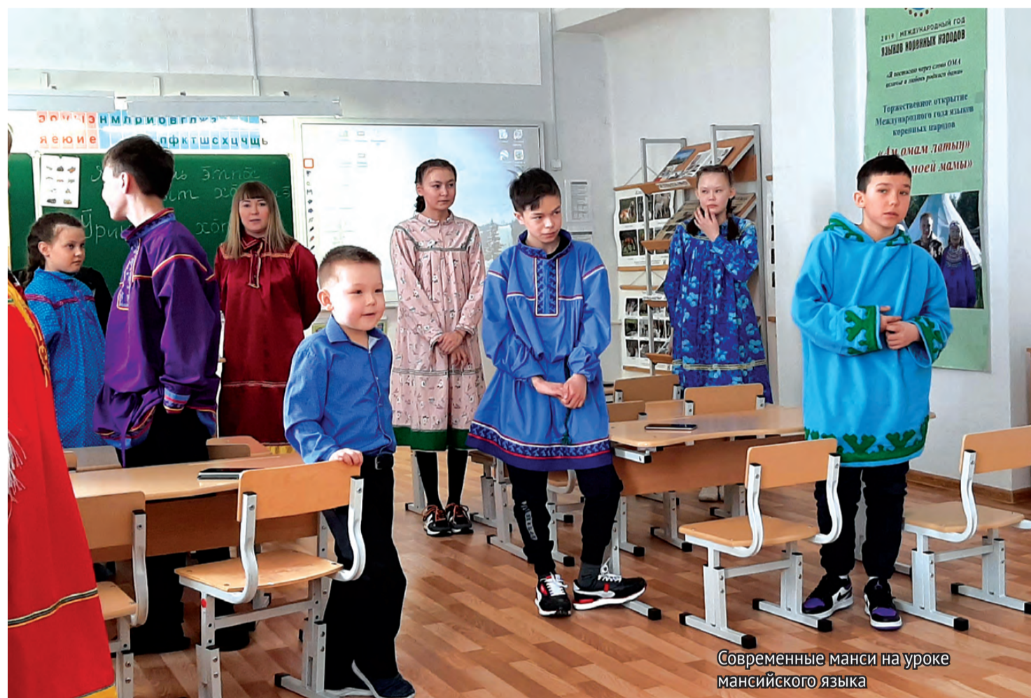
Современные манси на уроке мансийского языка

Сегодня в регионе делается всё, чтобы сохранить малые народности Урала. Так, в поселке Полуночное, который находится на самом севере Свердловской области, в школе № 3 не только учатся, но и живут 12 детей, представляющих коренной северный народ. Их родители всю свою жизнь проводят в тайге, занимаясь охотой, рыбалкой. Именно поэтому одна из первоочередных задач, которая стоит перед учителями – адаптировать детей манси к окружающему миру. Процесс социализации важен для полноценной жизни в обществе. Современные манси