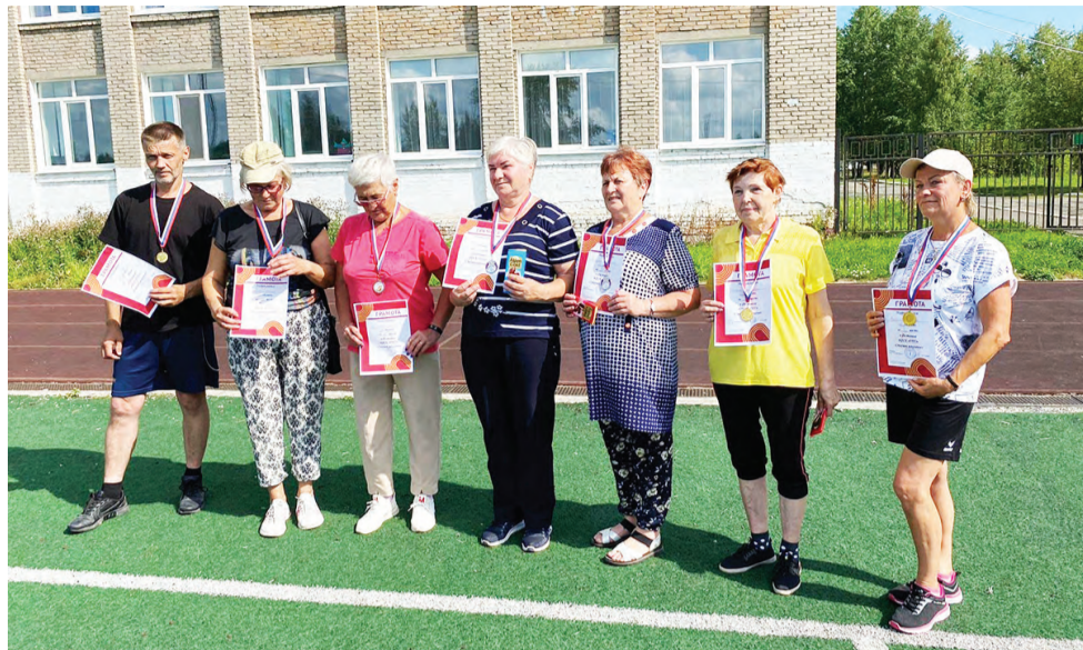
Вот они, смелые и ловкие участники многоборья

Программа многоборья включала отжимание, наклоны, поднимание туловища из положения лежа на спине, бег или смешанное передвижение на дистанции в 1 километр. Абсолютно все участники достойно выдержали испытания. Более того, пятеро спортсменов справились на «отлично» и уже через неделю пришли в Центр тестирования, чтобы выполнить нормативы и претендовать на знаки отличия ВФСК «ГТО». Среди претендентов: