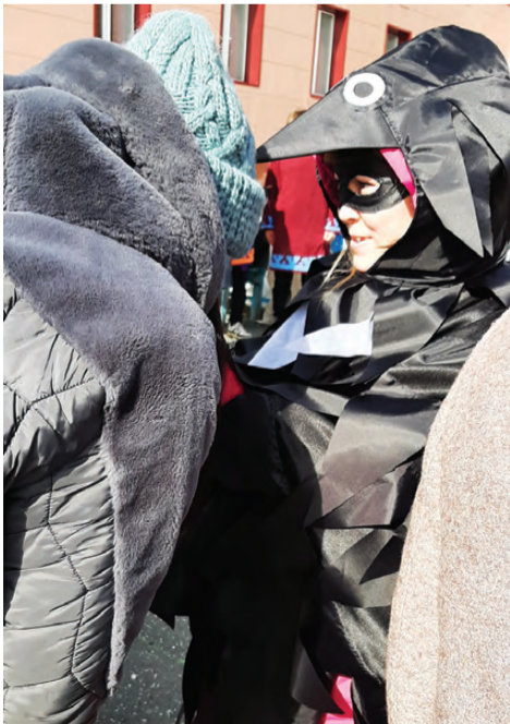
Ворона – священная птица у манси