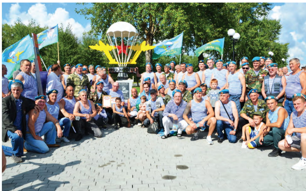
Войска «дяди Васи» на Аллее родов войск

Для тех, кто собрался на площади Аллеи Славы, девиз «Никто, кроме нас» – не просто слова. Для них нет невыполнимых задач. У многих за плечами – боевой опыт. А потому ежегодно 2 августа они собираются вместе, чтобы вспомнить годы службы и своих боевых товарищей.