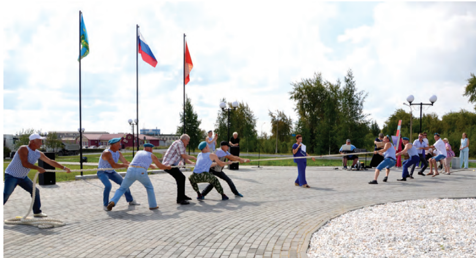
Состязание по перетягиванию каната

стелы «Никто, кроме нас». Это уже второй знак родов войск, который украшает