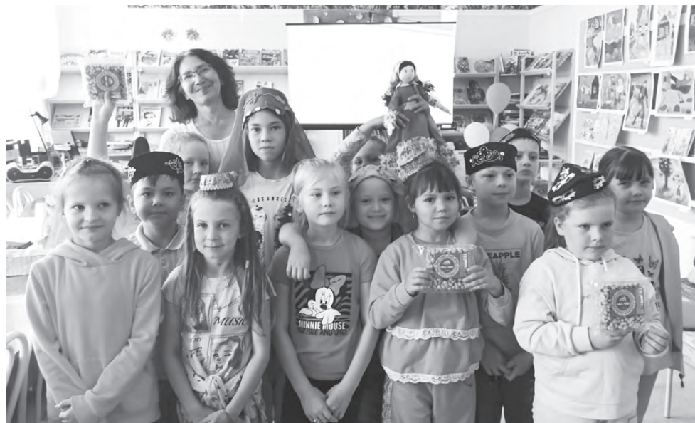
Мероприятие «Наша Родина – Урал» в библиотеке-филиале № 4 Красноуральска

Городской округ Рефтинский стал лучшим в номинации «Обеспечение эффективной «обратной связи» с жителями муниципальных образований, развитие территориального общественного самоуправления и привлечение граждан к осуществлению местного самоуправления в иных формах». Муниципалитету удаётся динамично развивать инициативное