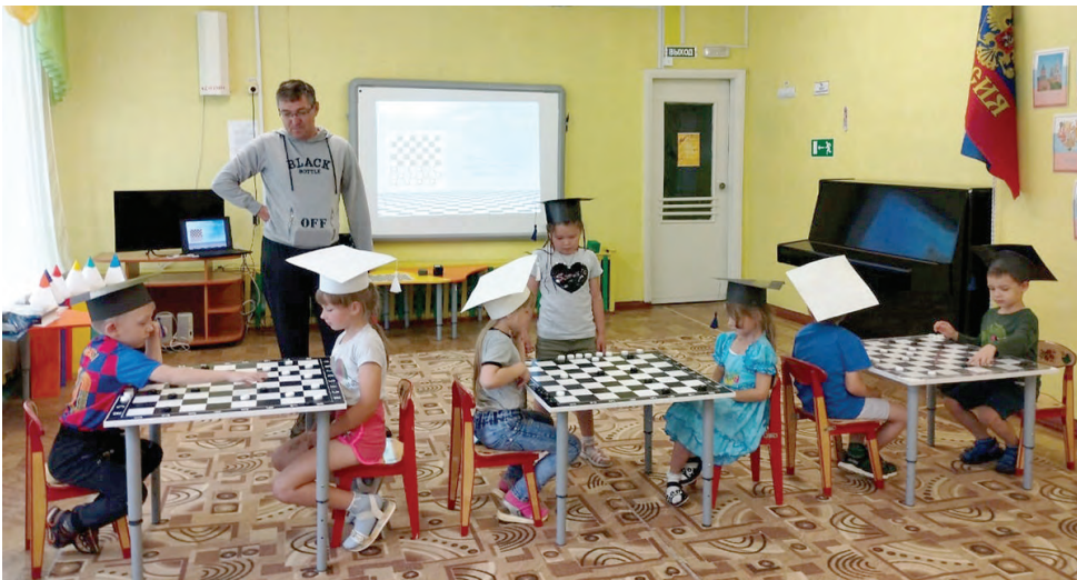
Шашечный поединок под руководством тренера

та и провел мастер-класс, где поделился секретами игры и научил мальчишек и девчонок, как за несколько ходов можно выиграть партию.