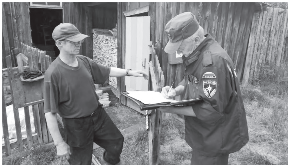
Профилактические беседы помогают спасателям в борьбе с пожарами

С собственниками жилья красноуральские спасатели беседуют о том, как вести себя в случае обнаружения очагов пожара и возможных возгораний, о соблюдении требований пожарной безопасности при эксплуатации бытовых электроприборов, отопительных печей и газового оборудования. После беседы каждому домовладельцу вручают памятки по соблюдению