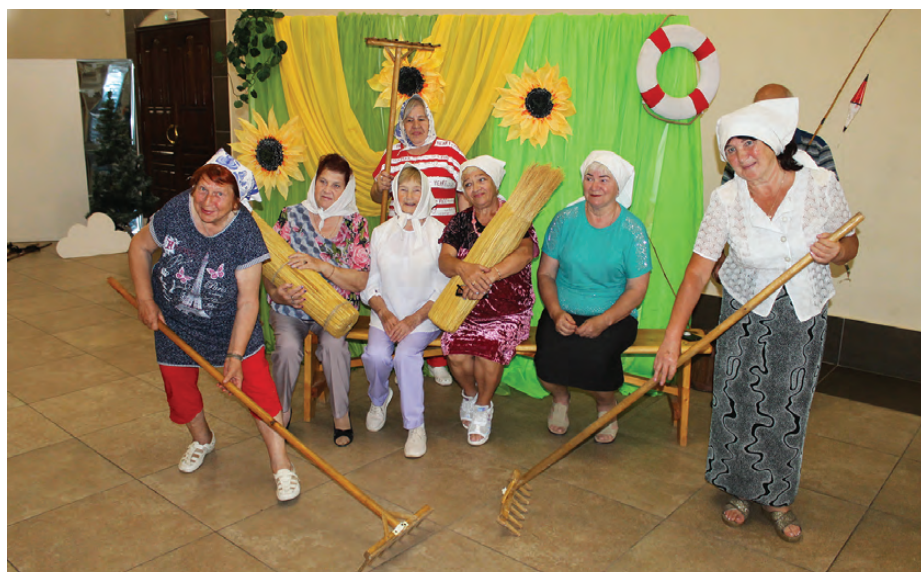
Эх, лето, покос! Вспомним молодость!

– Такого плана мероприятия проводятся уже не в первый раз, и старшее поколение с огромным удовольствием принимает в них участие, – рассказала «КР» методист МАУ ГО Красноуральск «Дворец культуры «Металлург» Ирина