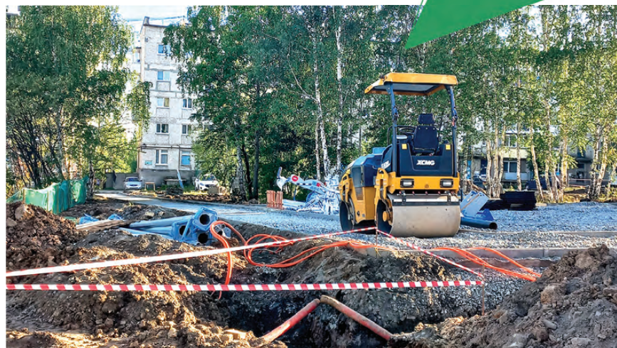
Техника на месте, ремонт в новом сквере идет по плану

ЖИЛЬЕ И ГОРОДСКАЯ СРЕДА НАЦИОНАЛЬНЫЕ ПРОЕКТЫ РОССИИ