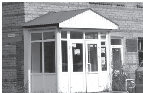
Капитальный ремонт кровли завершен

По словам медицинских работников, потребность в таких работах назрела уже давно. Особенно в последние годы, когда во время дождя или таяния снега сверху постоянно бежало. Как результат – вечно сырой потолок, стены, пол... Оно и понятно – ремонт кровли не проводился здесь более двадцати лет.