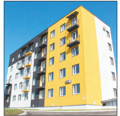
Счастья вашему дому!

И мы вместе с новыми жильцами побывали на экскур-