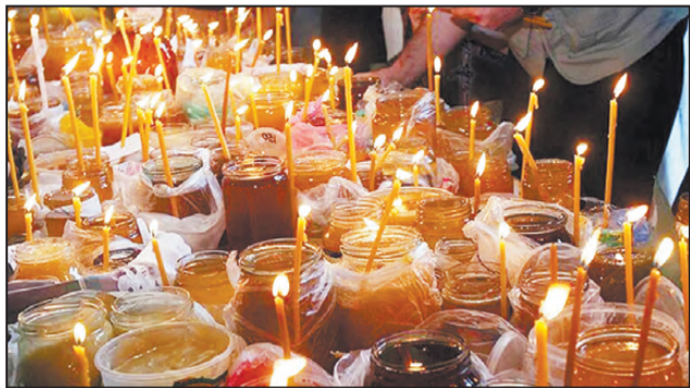
Мед и свечи