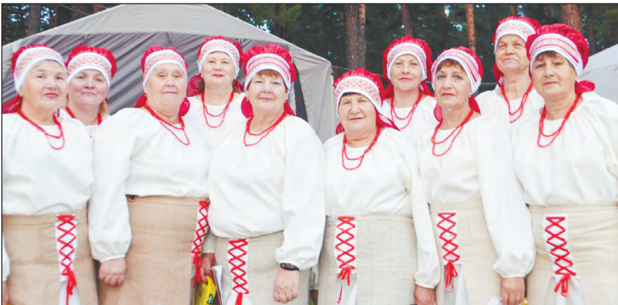
Хор клуба «Бодрость»