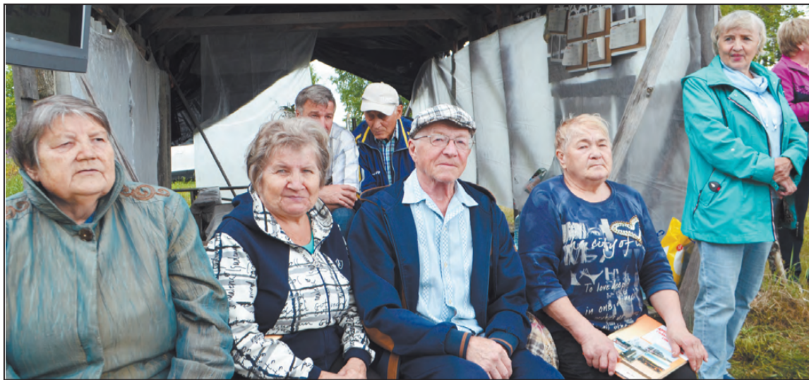
Ты наша колыбель родная! Как мы скучаем без тебя!