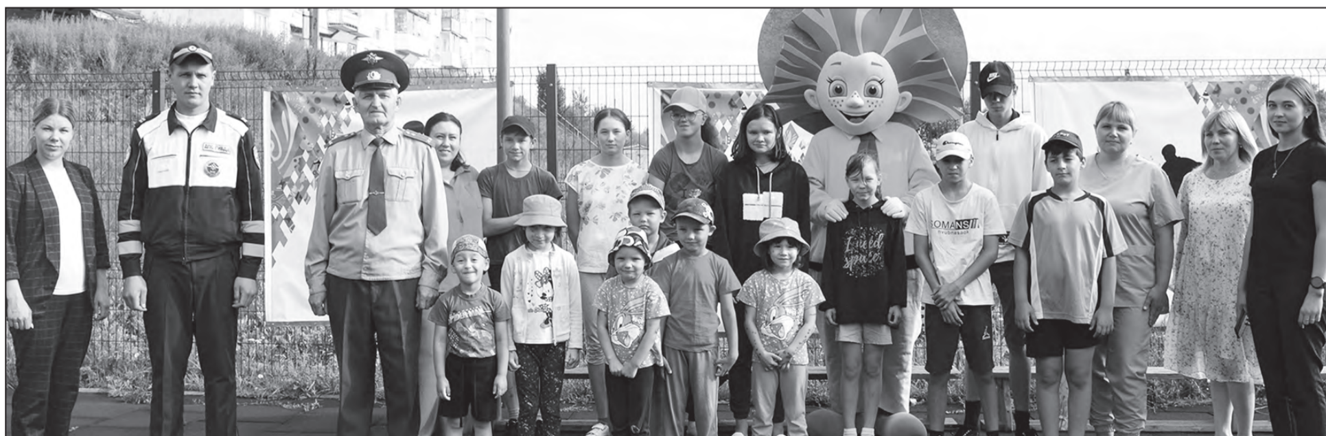
Чтобы тело и душа были молоды!

ОМВД России по Артинскому району