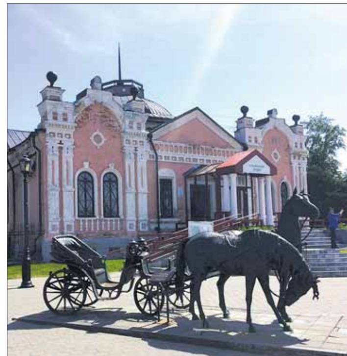
Губернский музей напротив Дома мастеров.