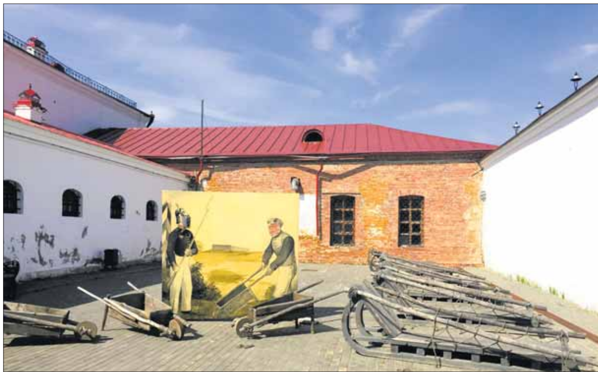
Двор пересыльной каторжной тюрьмы. Фрагмент музейного комплекса кремля.

Трагических страниц истории этого города набралось на толстенную книжку. Не скажу, что чувствуется переосмысление. Хотя и винить тоболяков не хочется, тогда уж и грехи уральской земли можно вспомнить и спросить себя: храним ли мы память о репрессированных, о замученных в лагерях НКВД, на пример?