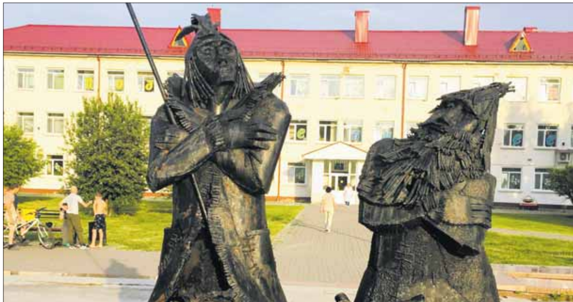
Робинзон похож на тунгуса, Пятница — на Виктора Цоя. Но важно, конечно, не внешнее сходство, а дух героического авантюризма, который здесь передан очень тонко. Памятник посвящен всем путешественникам, когда-либо посещавшим Тобольск.

элем Дефо об англичанине, проведшем 28 лет в одиночестве на острове, вы знаете. Роман вышел в 1719 году, успех его был так скор и оглушитель, что Дефо тут же написал еще одну книжку, она называлась «Дальнейшие приключения Робинзона Крузо». Ее герой попадает в Тобольск, пройдя со своим торговым караваном от Амура через Тунгусскую область и Енисейск. В Тобольске он решает провести «всю мрачную и суровую зиму». Книжка написана так же, как и первая, в жанре дневниковых записей. К сожалению, она не имела большого успеха, но любители ее хвалят за увлекательный этнографический экскурс.