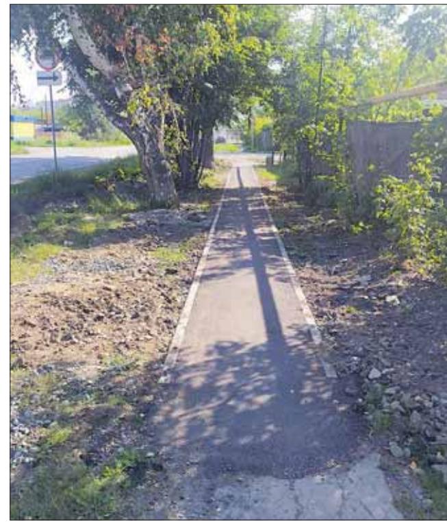
Хотя в контракте только тротуар по Энгельса, строители положили новый асфальт и на небольшом отрезке по улице Ленина.