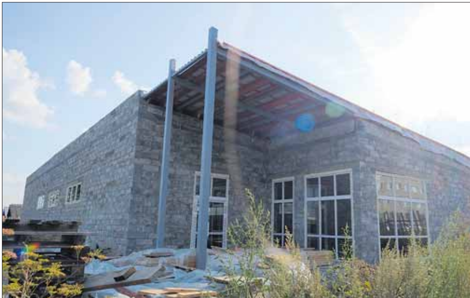
Пустырь на Российской — Фрунзе

«Европой») и обновленный ТЦ на месте кафе «Легенда» (якорный арендатор там — «Пятерочка», а еще работают обувной магазин и академия гимнастики).