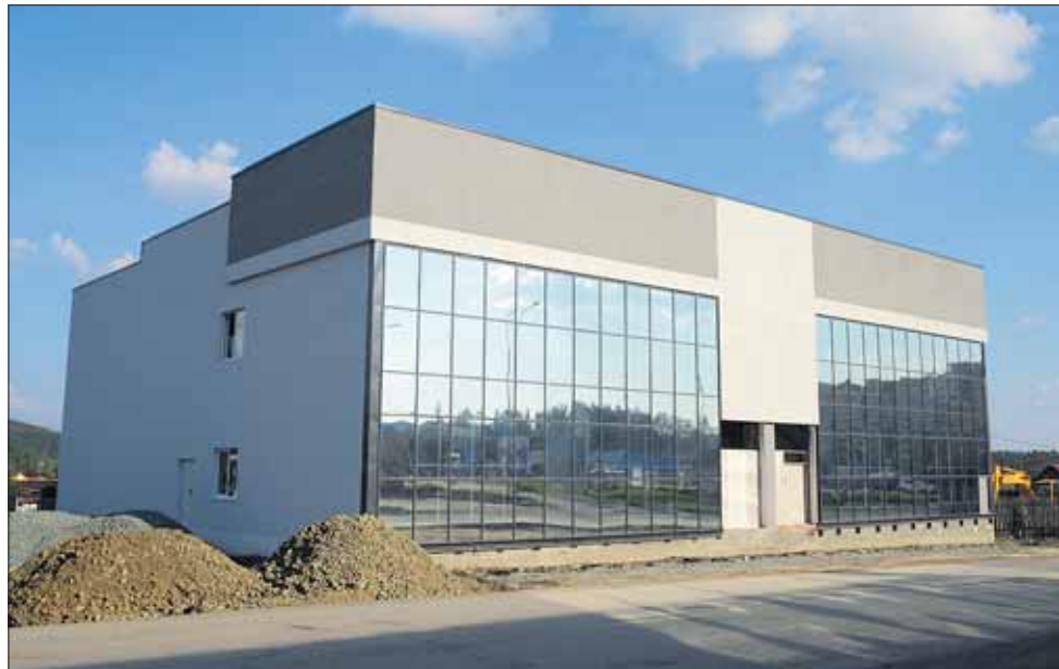
Бывшая автомобильная стоянка на Цветников, 57

Кадастровая стоимость: 1 838 149,64 руб. (было 1 865 390,56 руб.).