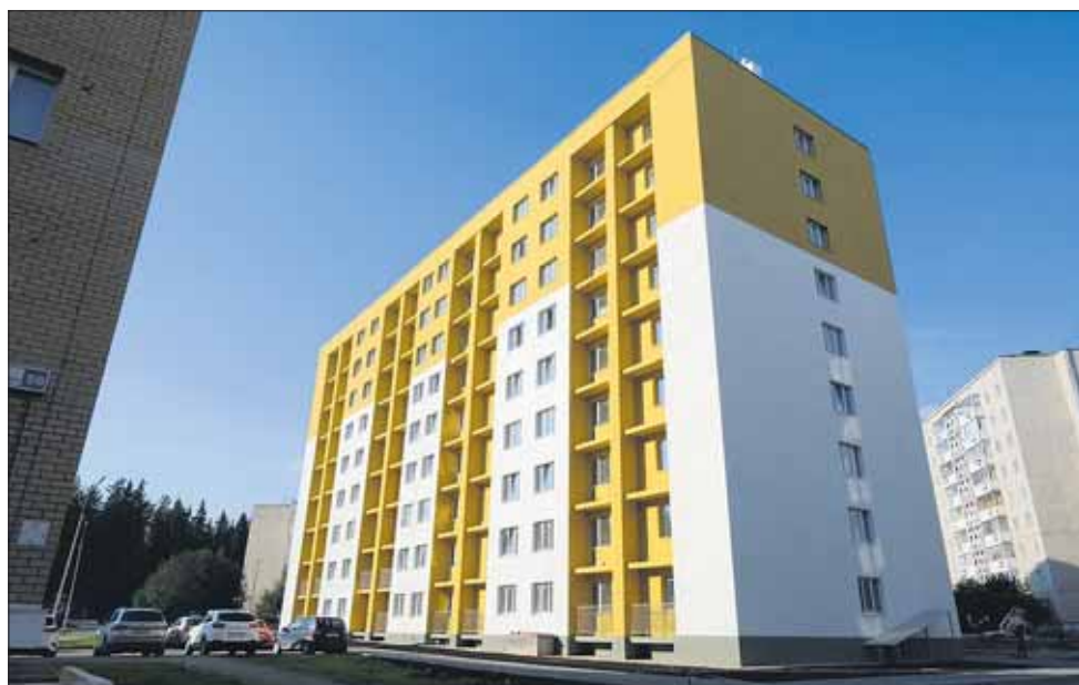
Дом на М. Горького, 52а

Кадастровая стоимость: 46 478 264,67 руб.