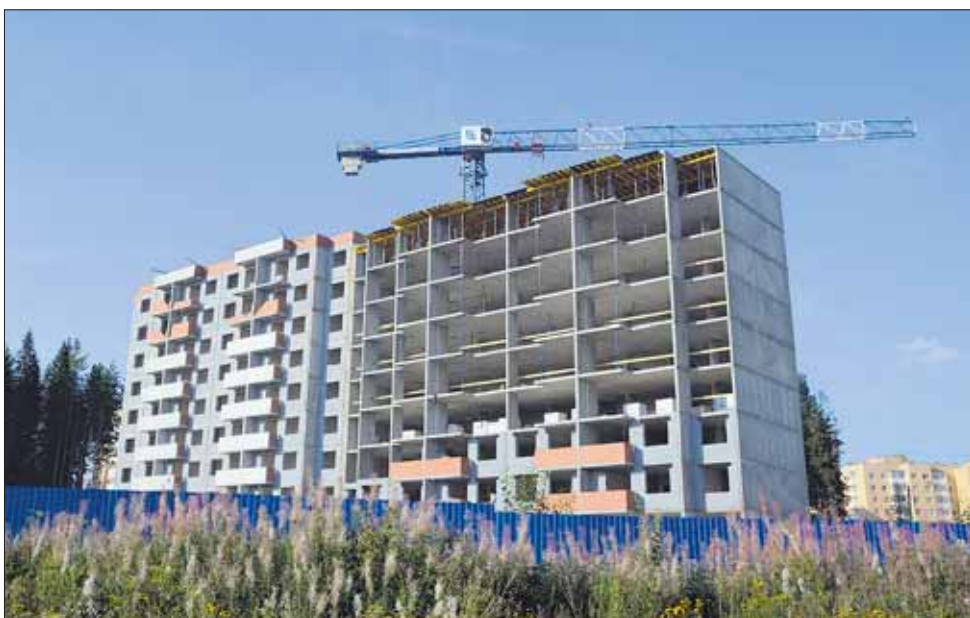
Новый ЖК на Интернационалистов

Кадастровая стоимость: 5 535 473,25 руб. (было 6 417 114,9 руб.).