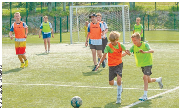
Фото: Город Качканар

В настоящее время рассматривается формат дальнейшего взаимодействия спортивной школы «Олимп» с коррекционной школой.