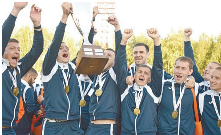
Обладатели Кубка Евраз – команда Распадской угольной компании

Кстати, финальные матчи на стадионе «Горняк» должен был комментировать Нобель