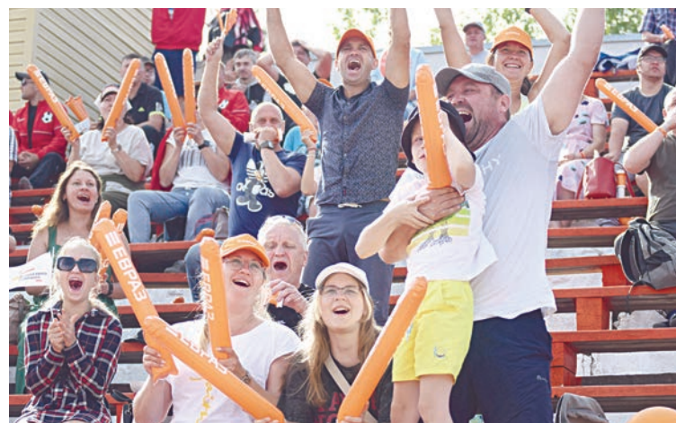
Самыми активными в этот день были болельщики