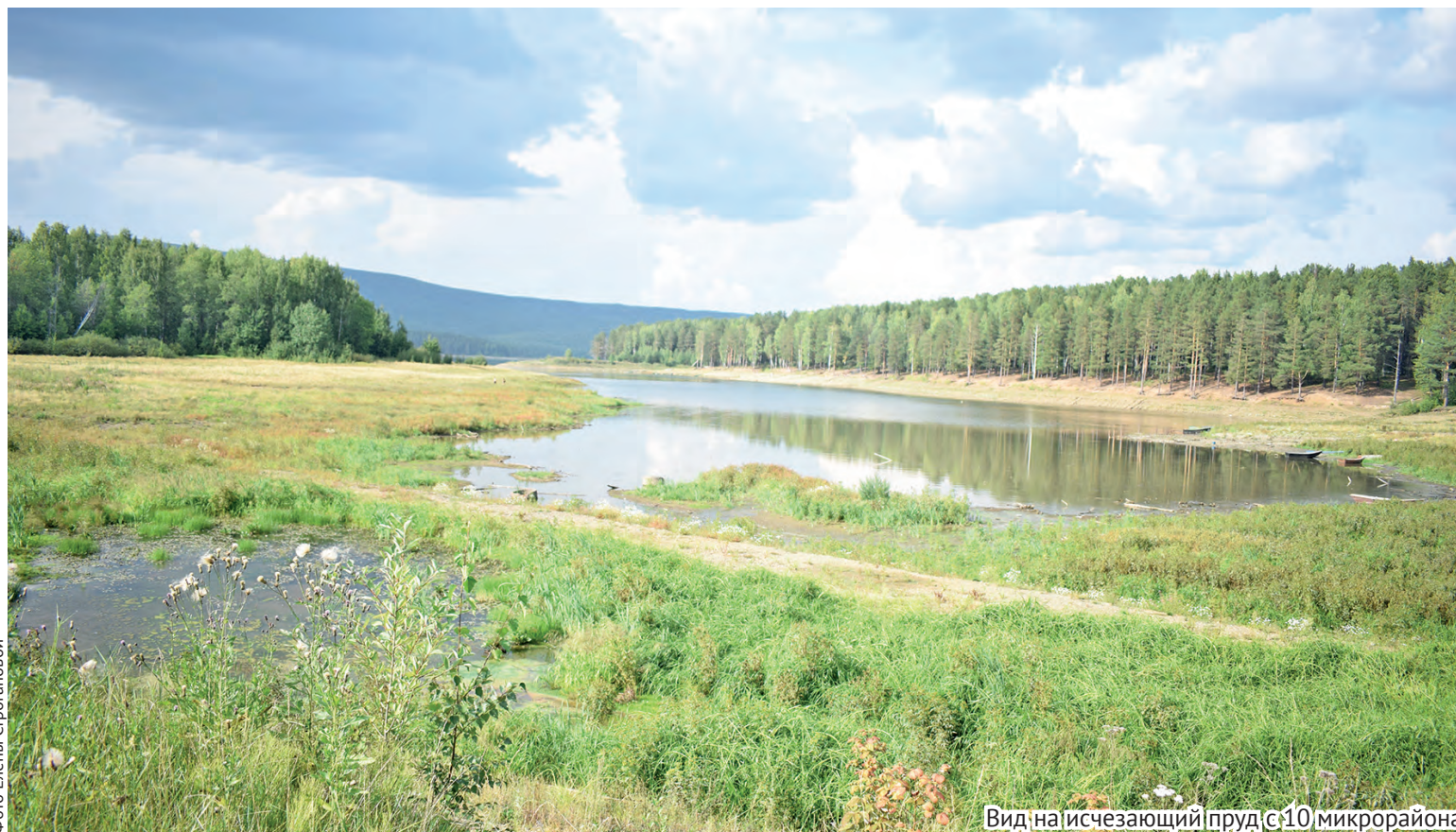
Вид на исчезающий пруд с 10 микрорайона

Конечно, все эти вопросы с рыбой в пруду, удру-