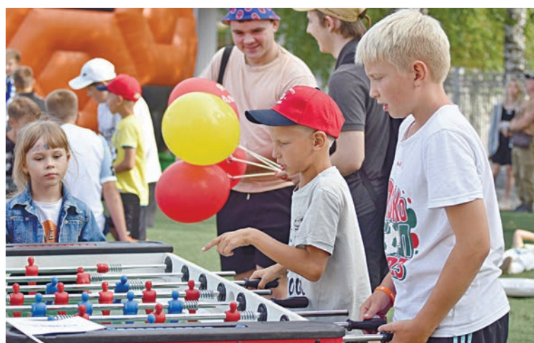
Дети тоже играли в футбол, только в настольный