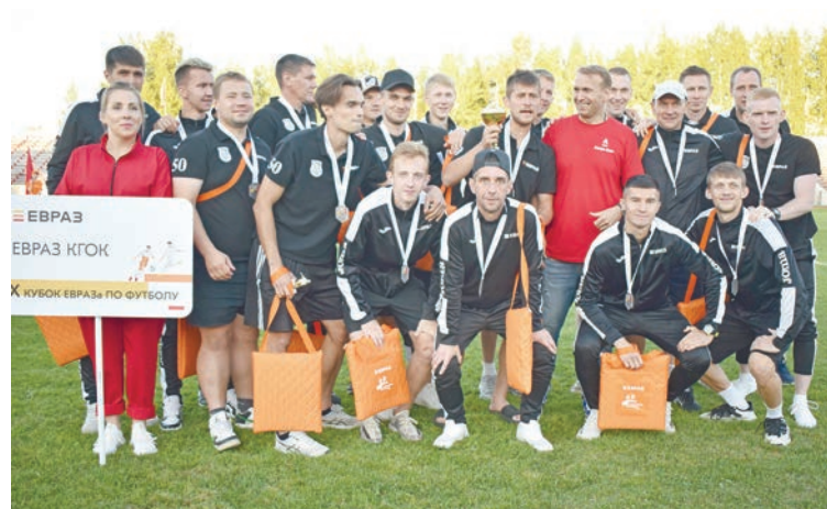
Качканарская команда «Горняк Евраз» заняла 2 место