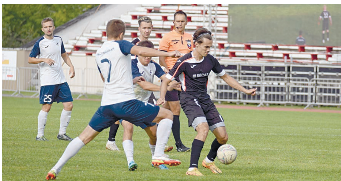
Момент финальной игры между командами «Горняк» и «Распадская»

За время участия в корпоративном турнире «Горняк» пропустил два тура чемпионата, но седьмую строчку в таблице не потерял. Также за это время произошло много интересного: первоуральский ТрубПром показал хороший отрезок и вырвался на четвертую строчку в турнирной таблице, алапаевский Триумф напротив — в начале сезона преследовал «Жасмин», а сейчас лишь шестой. Да и сам «Жасмин» в последних матчах растерял много очков, хоть и продолжает удерживать первую строчку в таблице, уже не так уверенно можно говорить о судьбе золотых медалей, ведь ему в спину дышат «Динур» и «Синара». Кстати, именно с первоуральским «Динуром» «Горняку» предстоит встретиться в ближайшем домашнем матче, который состоится 26 августа в 17 часов на стадионе «Горняк».