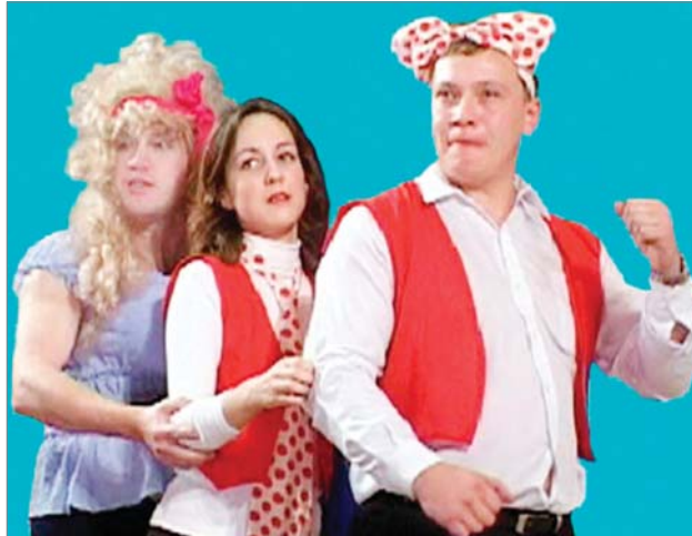
Сборная ЖДЦ-рудника «Мухоморы» - дебютанты 2004 года.

Февраль-2011 – время проведения седьмого заводского конкурса. Темой конкурса стали «Олимпийские резервы «ДИНУРА». На участие заявили шесть команд: «Революция» (цех №1), «Коксон» (цех №2), «Огнеупорные колобки» (сборная рудника, РСУ и энергоцеха), «Олимп» (МЛЦ и заводоуправление), «Великолепная семёрка» из УСР и АТЦ, «Весёлые ребята» (сборная ЦЗЛ-ЦЛМ).