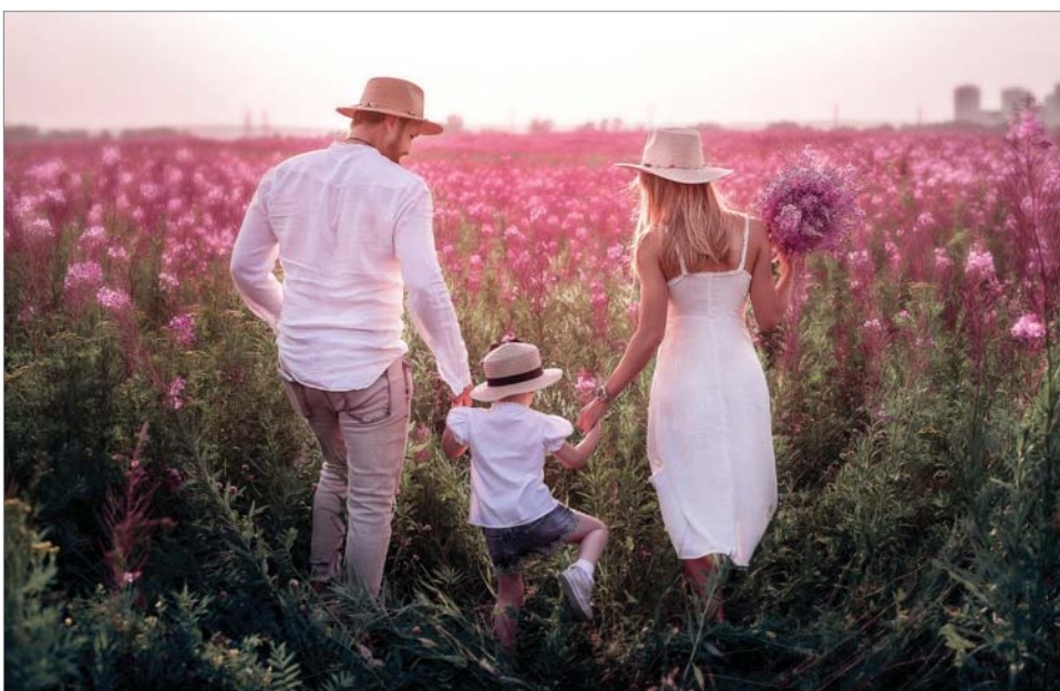
Семейное фото излучает тепло.

Сегодняшняя реальность – тёплые семейные снимки. Когда малыш подрастёт, папа планирует вернуться к красивым отпускным фотосессиям. Коллекция мгновений, остановленных в разных уголках страны и мира, собрана неплохая. И есть мечта её пополнить.