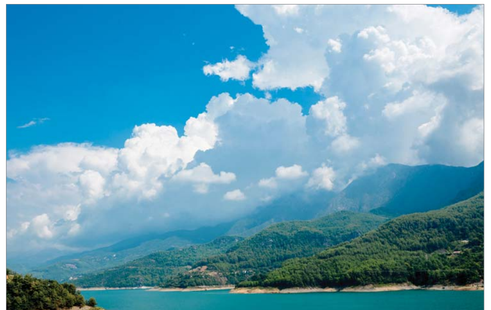
Пейзаж – находка для фотографа.