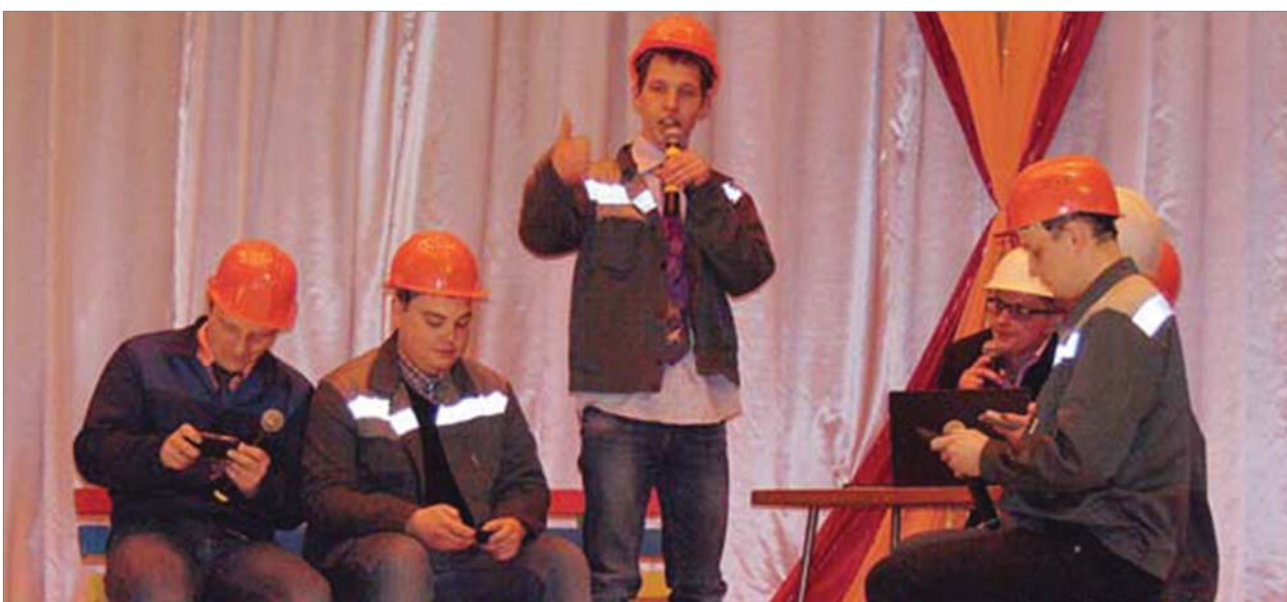
«Стиляги» из второго цеха. 2017 год.

Взгляд в историю позволил увидеть, что КВН «живёт» в заводской истории пунктиром – пару лет играем, потом перерыв – и снова на сцену.