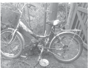
Женский велосипед. Цена 5 тыс. руб. Тел 8-905-807-36-63.

■ Стиральную машину "Малютка". 3-литровые стеклянные банки и 700-граммовые. Тел. 8-953-054-29-54.