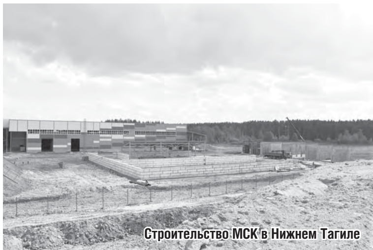
Строительство МСК в Нижнем Тагиле

Никто не собирается размещать полигоны рядом с эндемиками, редкими растениями, краснокнижными представителями флоры и фауны, водными сетями, водохранилищами, речными артериями и источниками подземных вод. Все это просто запрещено законодательством.