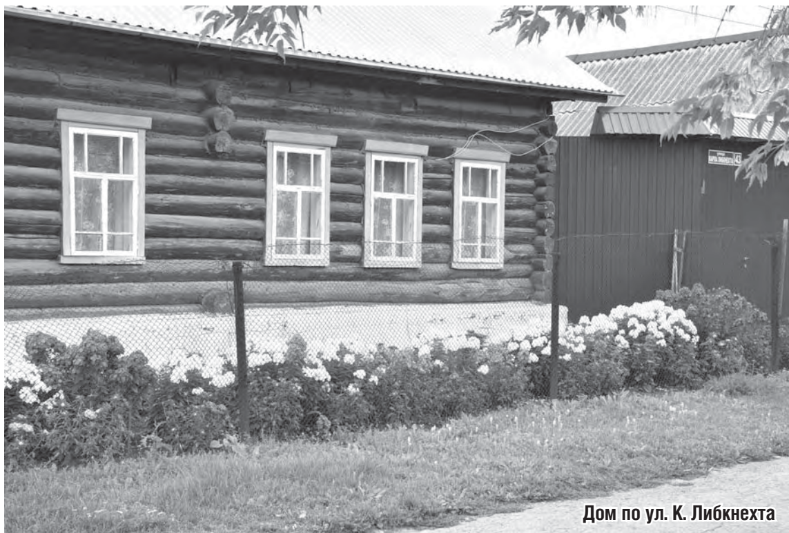
Дом по ул. К. Либкнехта

прямо напротив редакции. Представьте, если бы каждый хозяин содержал свой дом, палисадник, участок перед домом так, как хозяева этого дома! Какой бы был наш город!