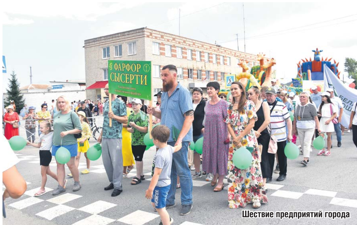
Шествие предприятий города