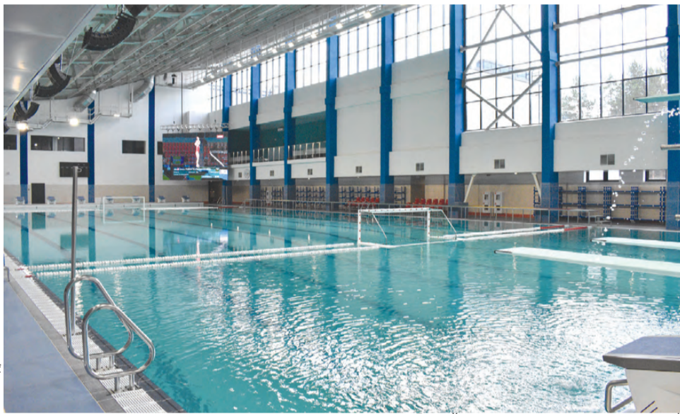
Бассейн скоро откроется для посетителей

Знакомство началось с малого бассейна, где могут заниматься дети и люди с ОВЗ. Тут же показали тот самый подъемник, продемонстри-