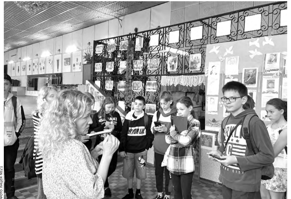
ФОТО ЛИЦЕЯ №21