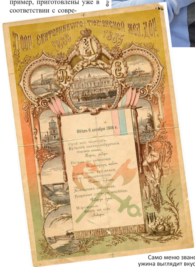
Само меню званого ужина выглядит вкусно