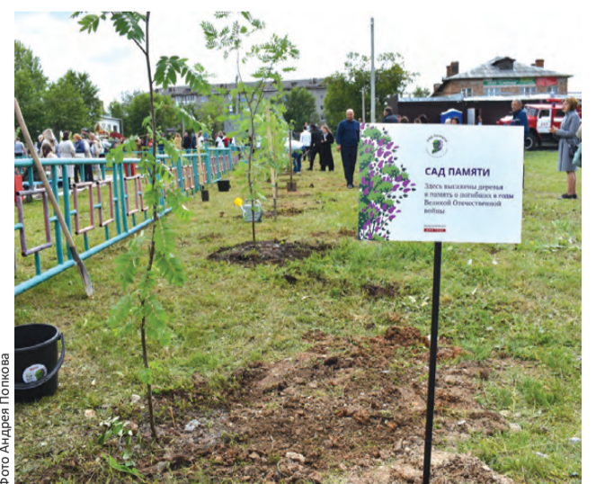
Сад Памяти – начало Парка Победы