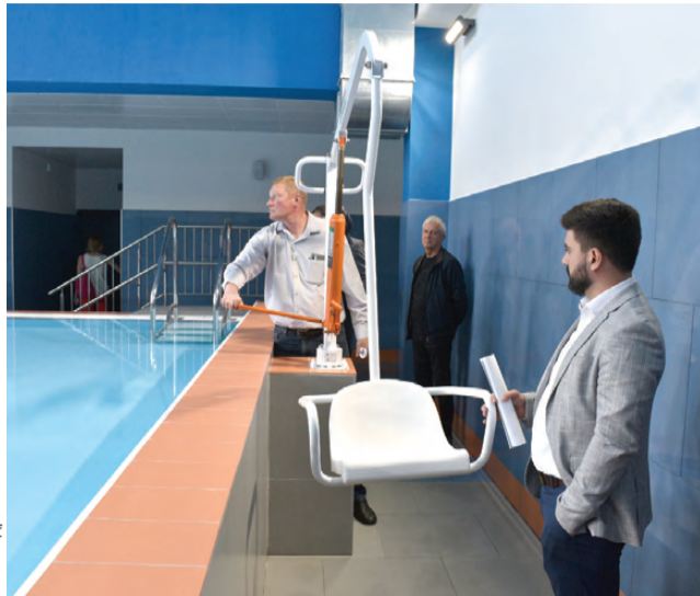
Тот самый подъемник для инвалидов: погружение – с полным комфортом