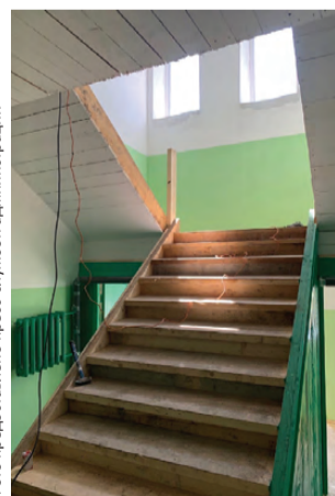
Сакко и Ванцетти, 3: ремонт подъезда завершается

Кабец выразил благодарность всем, кто принимал участие в тушении пожара и оказывал помощь жителям. Это не только огнеборцы, но и ОМВД, социальные службы. Пока