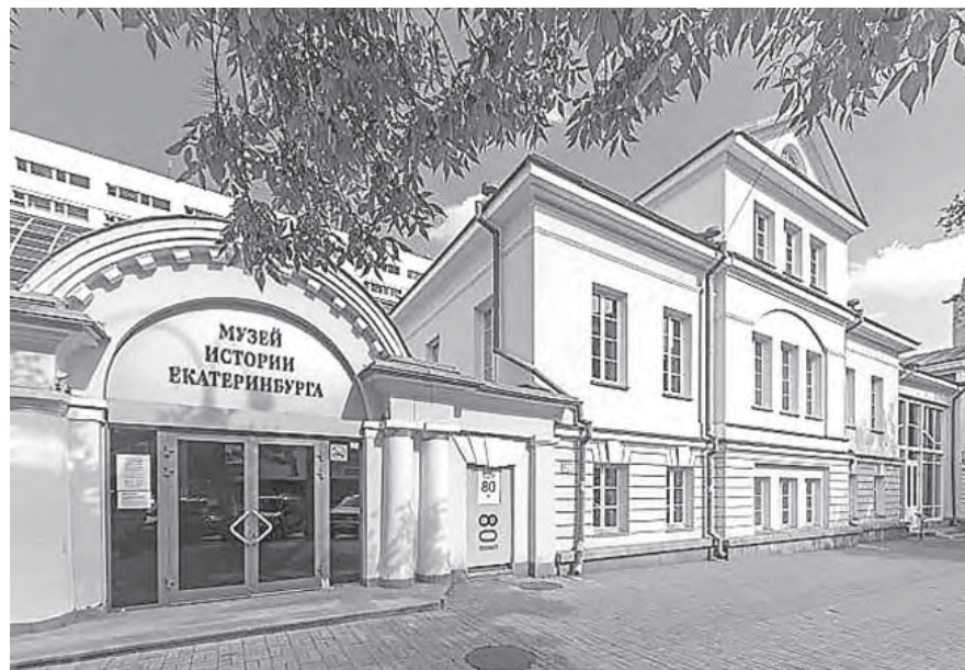
Фото из домашнего архива.