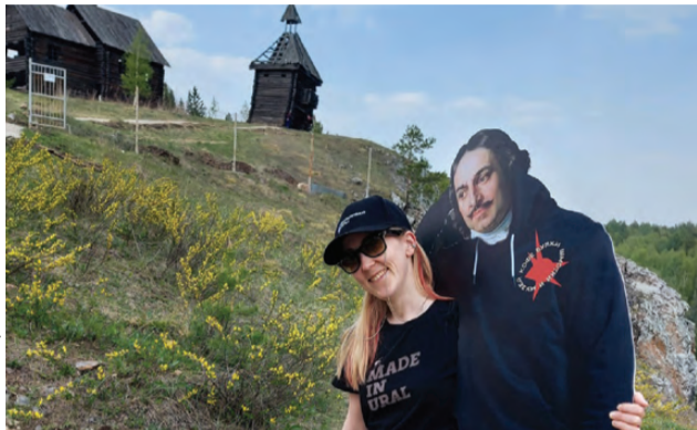
Современный Петр I в худи «КБШИМ» путешествует по окрестностям