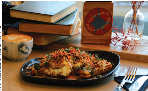
А так выглядит одна из позиций уральского меню – вафля с репой