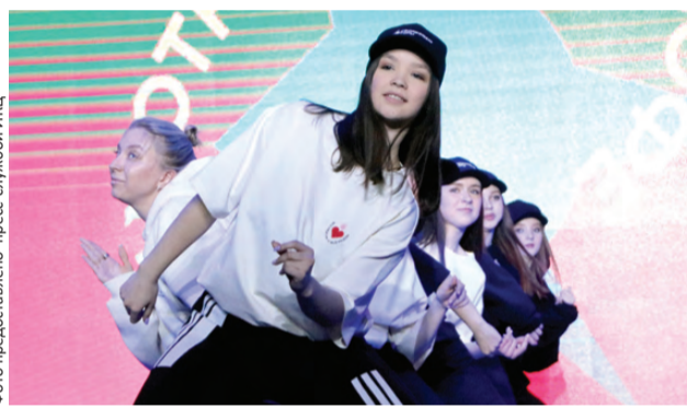
На одной из презентаций проекта его мечт представляли подростки

– Благодаря таким нестандартным экскурсиям первоуральцы приходят в место экс-