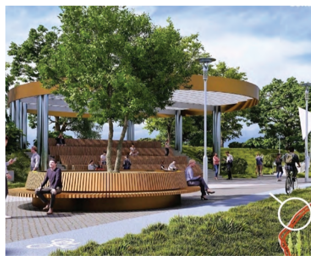
Так выглядят эскизы IV этапа благоустройства набережной

региона за историю проекта: в 2021 году за обновление городских пространств высказалось чуть более 500 тысяч жителей, в прошлом году количество проголосовавших увеличилось до 703 тысяч. С таким высоким результатом Свердловская область стала абсолютным лидером Российской Федерации по количеству вовлеченных в проект жителей отдельного региона. И это не последнее достижение – Свердловская область также вошла в топ-5 по числу