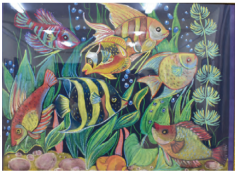
Глубины и их обитатели