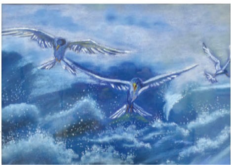
Спокойное море не так изобразительно