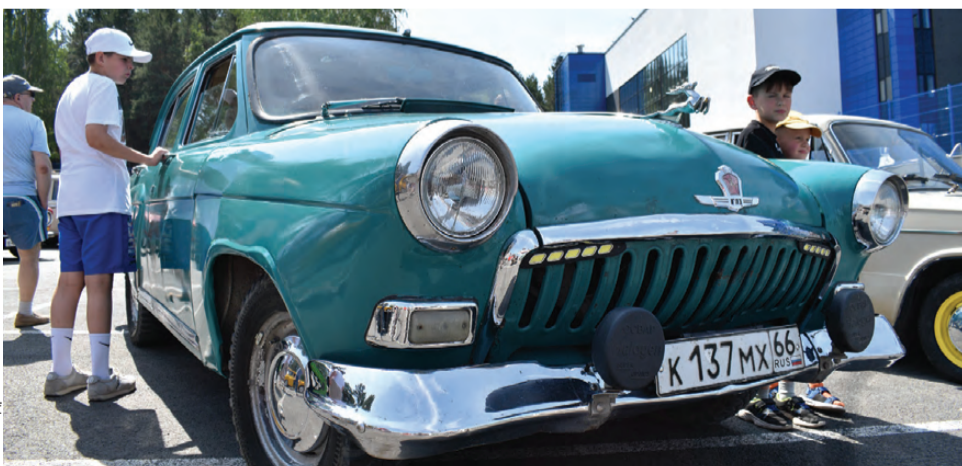
«Волга» ГАЗ-21, в советское время их выпустили разных моделей более полумиллиона штук

Первоуральцы по достоинству оценили выставленные автомобили. Из легенд отечественного автопрома наибольшей популярностью пользовались две «Волги» ГАЗ-21, сошедшие с заводского конвейера в конце 50-начале 60-х годов прошлого века. Старшей из них исполнилось 64 года. Большим вниманием пользовался и легендар-