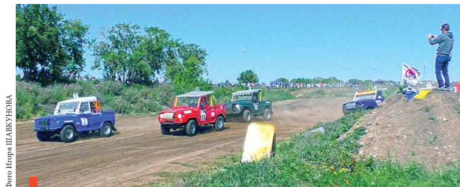
На сухоложской трассе – экипажи гонщиков

Состоялся третий этап чемпионата Свердловской области по автокроссу на призы компании «ФОРЭС» в категории Т1 – 2500 (УАЗ).