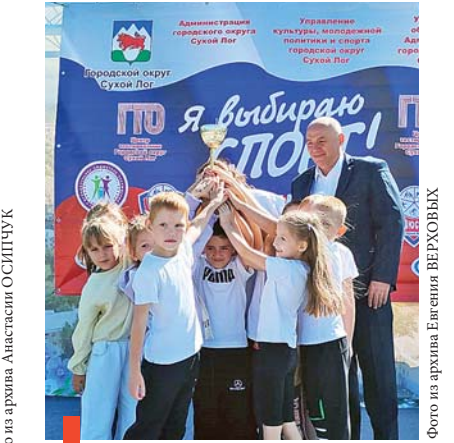
Команда д/с №29 – победитель спартакиады