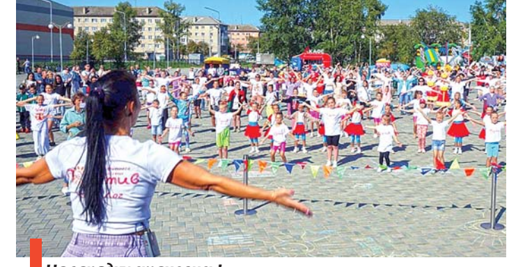
На зарядку становись!

Утро началось с зарядки и вручения наград лучшим работникам физической культуры, спортсменам, тренерам, командам.