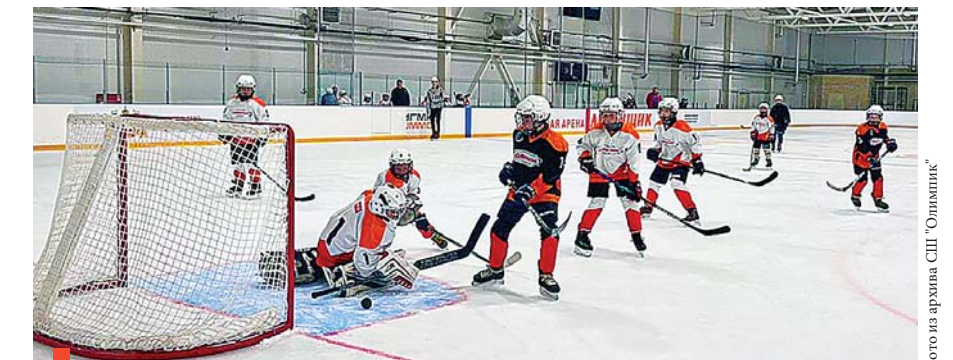
Опасный момент у ворот

В товарищеском матче по хоккею с шайбой между воспитанниками спортивной школы «Олимпик» 2012–2013 годов рождения победу одержали хоккеисты старшего возраста.