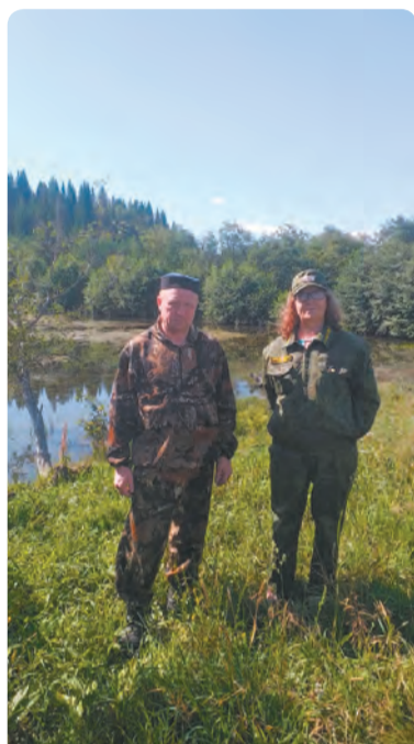
Рейды проходили как в самой Бисерти, так и в Киргишанах

На Урал вновь вернулась жара (хоть на этот раз и с дождями), поэтому в Свердловской области усиливается противопожарный режим – и в эти выходные профилактические противопожарные рейды снова прошли с проверками по населённым пунктам и лесам вокруг них.