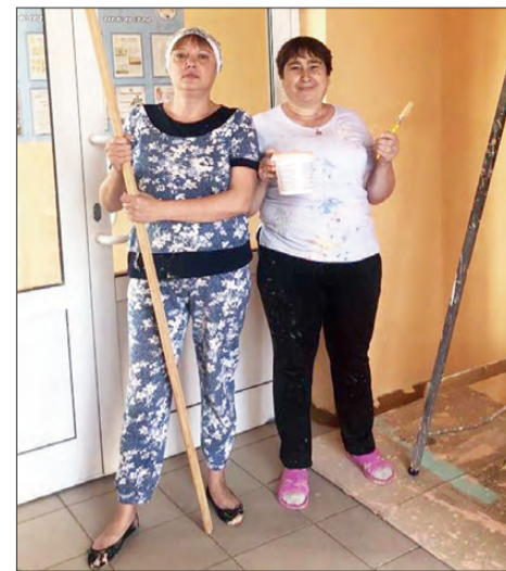
Школа №16 готовится к новому учебному году

Приёмка образовательных организаций города к новому 2023-2024 учебному году начнётся с 8 августа.