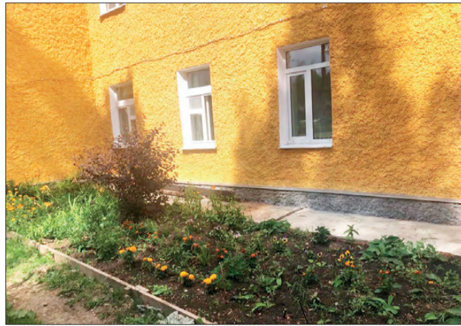
Во дворе по Циолковского,9