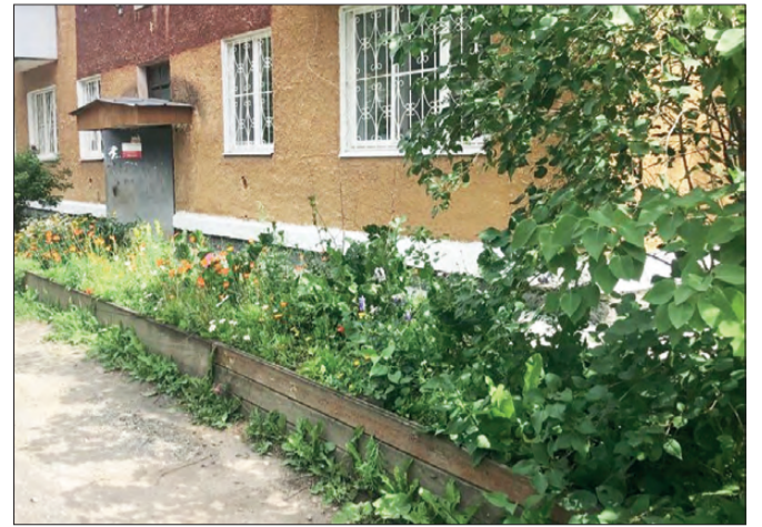
Красота двора по Димитрова,20

Лето радует нас своими яркими красками. Вдвойне приятно благодарить за буйное разноцветье не только природу, но и людей, украшающих разные уголки Дегтярска!