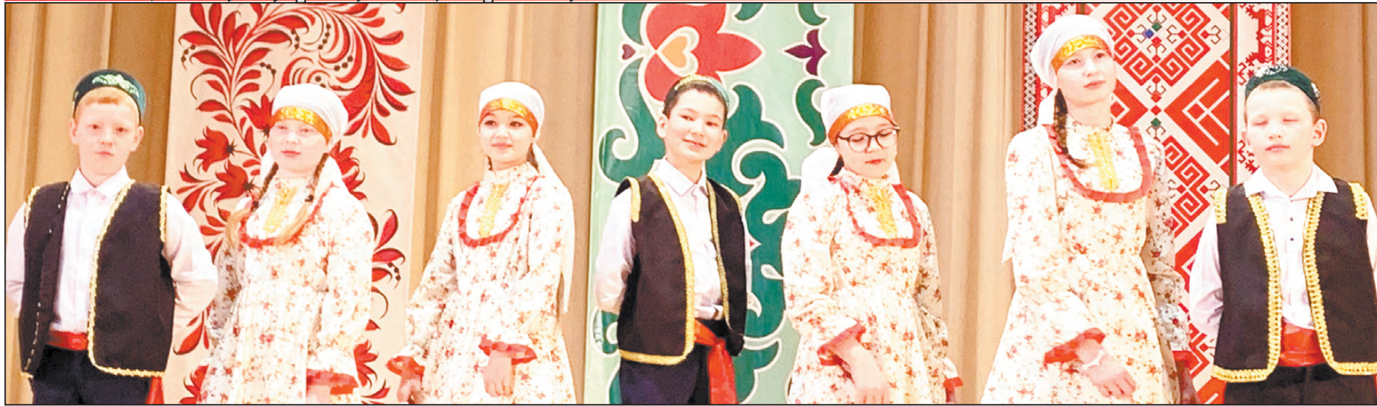
Подрастает достойная смена участникам художественной самодеятельности! Танцевальный коллектив «Яшьлек», с. Азигулово