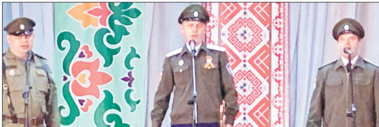
Вокальная группа «Хуторок», д. Малые Карзи

Управления культуры Фото из архива Управления культуры