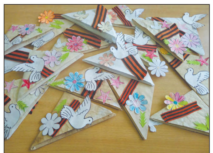
«Солдатские треугольники» сложили обучающиеся Нижнебардымской школы

О. ЯНИЕВА, Верхнебардымская библиотека-клуб