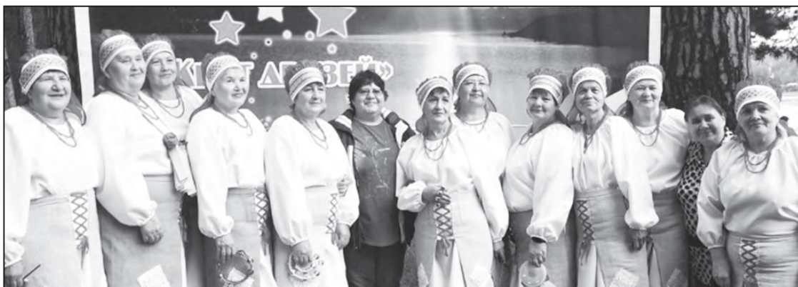
Пожелания записала Татьяна ЧЕРЕПАНОВА

Тропинка приведет сюда. С Днем поселка, дорогие земляки!