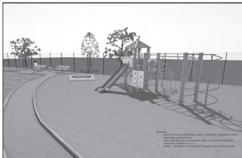
Проект «Спортивная площадка «Территория роста»

Дальше начали решать организационные вопросы. Для изготовления проектно-сметной документации мы выбрали ООО «УралСпецСтрой». А экспертизу провело ООО «Уральский региональный центр экономики и ценообразования в строительстве». По проекту площадку поделили на две зоны. В первой расположили футбольное поле с возможным применением его для игры в волейбол с установкой баскетбольного кольца. Во второй спланировали спортивные тренажеры: турники, брусья, рукоходы; асфальтированную дорожку; детскую горку; песочницу. Для безопасности зоны будут огорожены сеткой высотой около шести метров. Предусмотрено видеонаблюдение и