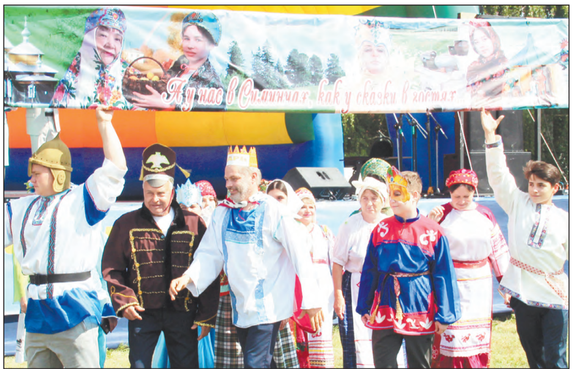
«Очень приятно, царь!» Симинчинская сельская администрация

А между тем народ угощается чаем и пирогами на двадцати подворьях. Предметы быта, фотографии (у ЦДО подворье