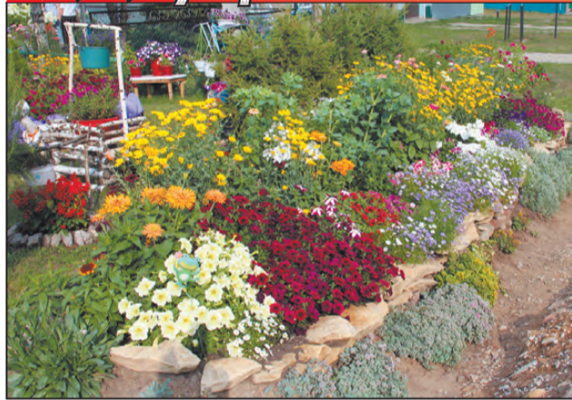
Яркие краски у дома Власовых