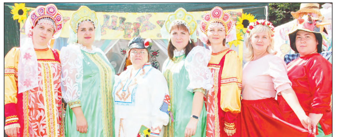
Это не подворье детсада, это просто «Радуга» какая-то!

Светлана БАЛАШОВА Все фото смотрите на странице «Артинских вестей» «ВКонтакте»