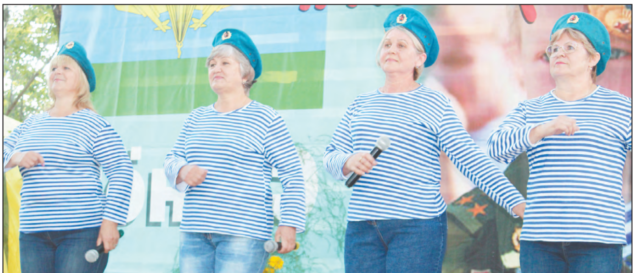
Бравые десантницы Барабы